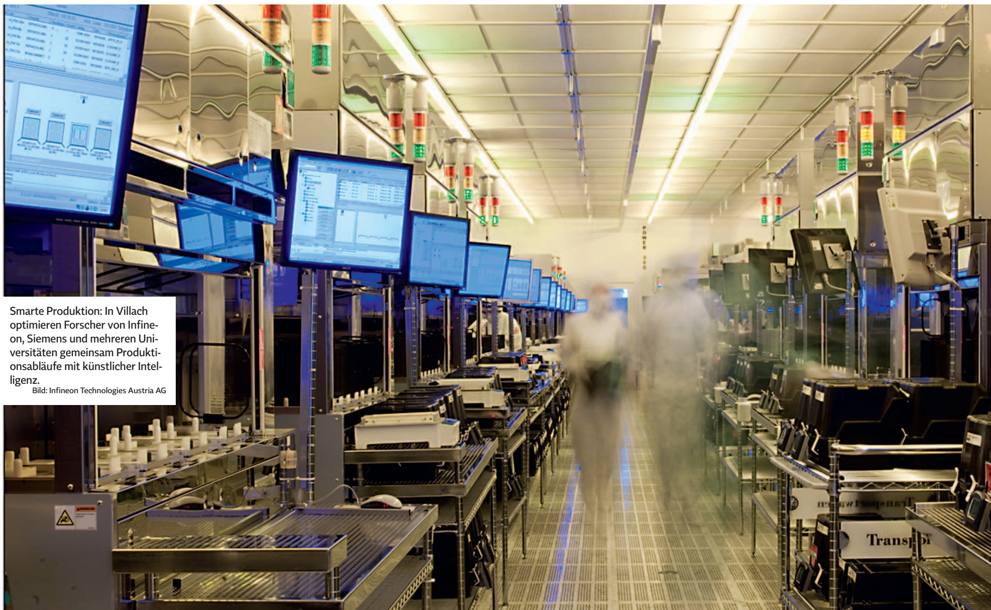
Smarte Produktion: In Villach optimieren Forscher von Infineon, Siemens und mehreren Universitäten gemeinsam Produktionsabläufe mit künstlicher Intelligenz.