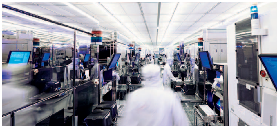
Infineon investiert kontinuierlich in die Infrastruktur ihres Innovationszentrums für Leistungselektronik in Villach. In dem Pilotraum Industrie 4.0 entstand ein neuartiges Konzept der vernetzten und wissensintensiven Produktion.

extrem hoch“, sagt Ernis und nennt eine Faustregel, die besagt, dass für jeden Parameter, den man in dem Modell anpassen kann, 10 Datenpunkte benötigt werden. „In einem tieferen neuronalen Netz gibt es ungefähr 100 000 anpassbare Parameter, also 1 Mio Datenpunkte, und die sind nicht aus jeder Anlage extrahierbar“, so Ernis. Außerdem beruht Deep Learning auf dem Prinzip des Lernens durch Fehler. „Einer Produktionsanlage, die selbstständig lernen und sich verbessern soll, müsste gestattet werden, Fehler zu machen. Und das heißt gegebenenfalls auch Ausschuss zu produzieren, denn Fehlentscheidungen gehören zu einem Lernprozess dazu. Das können wir uns in einer realen Produktion aber meistens nicht leisten“, betont Prof. Zühlke. Der Siemens-Mann Quendt sieht das ähnlich: „Ein ‚Lernen durch Fehler‘ ist in der Industrie natürlich heikel bis indiskutabel und es müssen andere Herangehensweisen gewählt werden.“ Und die gebe es, so Quendt. Wenn das benötigte Neuronale Netz beispielsweise nicht ganz so weit in die Tiefe gehen muss, sieht das schon ganz anders aus. „Einfacher ist es, KI in eingeschränkteren Einsatzfällen einzusetzen,