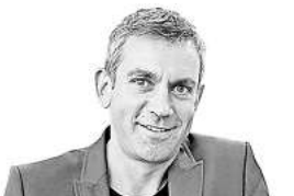
Von Wladimir Kaminer