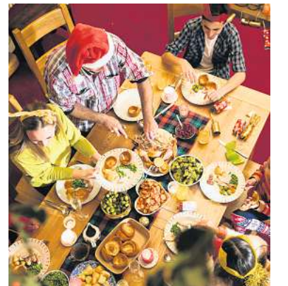
Fröhliche Familientafel – mit etwas Einsatz lässt sich vermeiden, dass die Stimmung kippt.