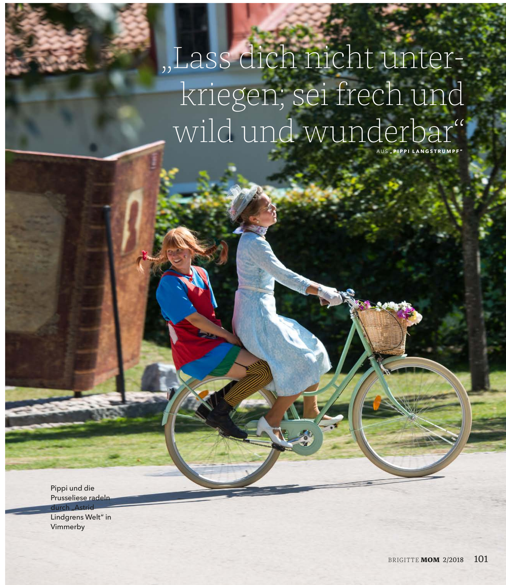
Pippi und die Prusseliese radeln durch „Astrid Lindgrens Welt“ in Vimmerby