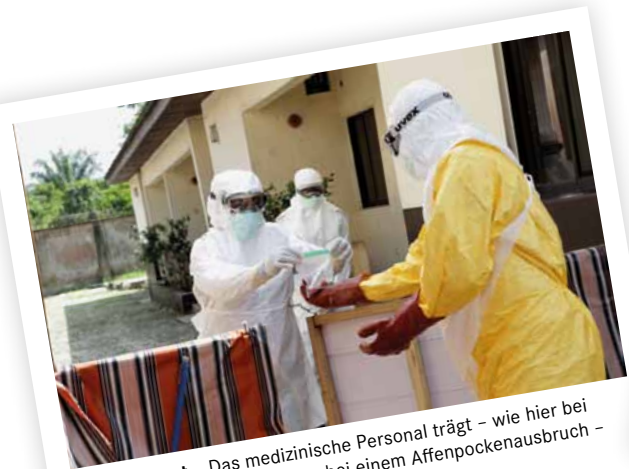
Abgeschirmt Das medizinische Personal trägt – wie hier bei der Übergabe von Blutproben bei einem Affenpockenausbruch – immer Schutzkleidung.