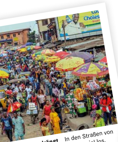
Dicht gedrängt In den Straßen von Nigerias Städten ist meist viel los.