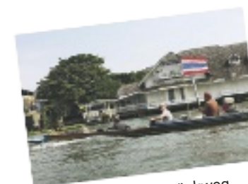
Ciao, Chao Phraya! Rückweg im Longtail. Bangkok oft verflucht. Wieder in Deutschland. Sehnsucht nach Bangkok