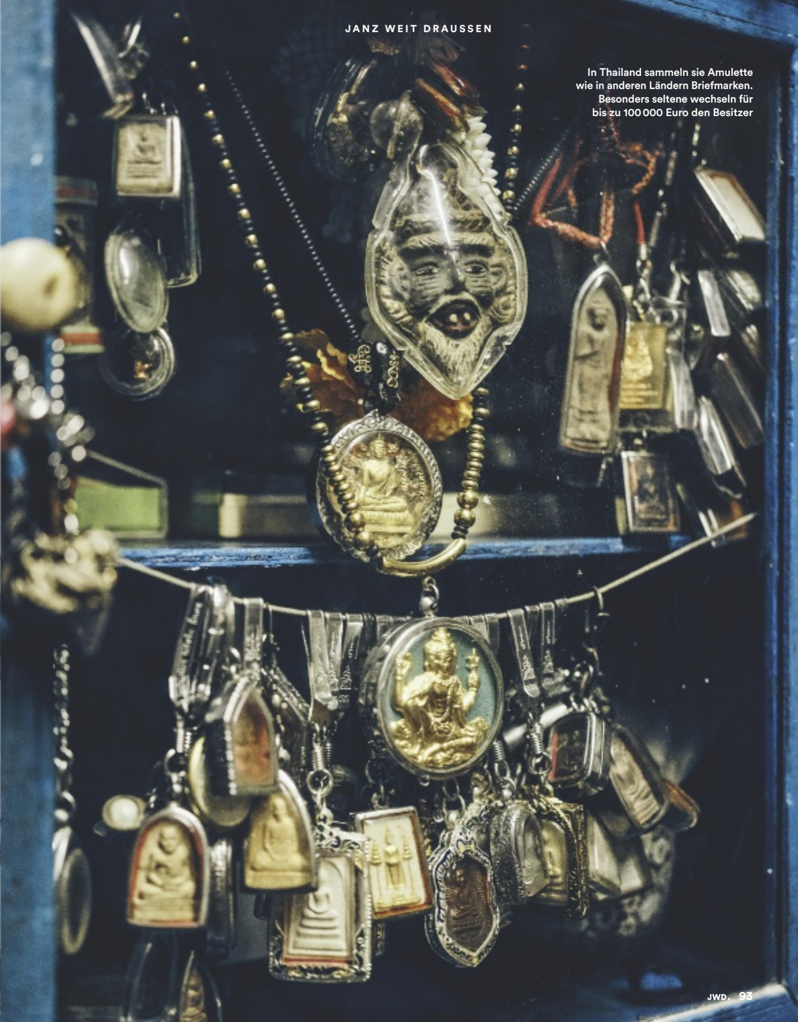
In Thailand sammeln sie Amulette wie in anderen Ländern Briefmarken. Besonders seltene wechseln für bis zu 100 000 Euro den Besitzer