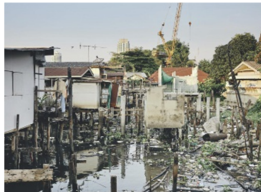
Rücksicht auf Traditionen? Nicht in Bangkok. Die ersten Pfahlbauten der Flusstäucher wurden abgerissen. Wo ihre Siedlung steht, soll eine Uferpromenade gebaut werden

Mit Enttäuschungen kennen sich die Schatztaucher auch aus.