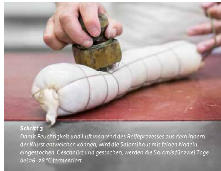
Schritt 3 Damit Feuchtigkeit und Luft während des Reifeprozesses aus dem Innern der Wurst entweichen können, wird die Salamihaut mit feinen Nadeln eingestochen. Geschnürt und gestochen, werden die Salamis für zwei Tage bei 26–28 °C fermentiert.