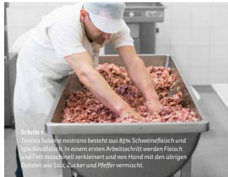
Schritt 1 Toninis Salame nostrano besteht aus 85% Schweinefleisch und 15% Rindfleisch. In einem ersten Arbeitsschritt werden Fleisch und Fett maschinell zerkleinert und von Hand mit den übrigen Zutaten wie Salz, Zucker und Pfeffer vermischt.