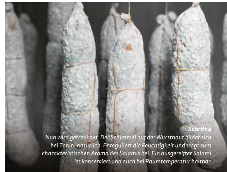
Schritt 4 Nun wird getrocknet. Der Schimmel auf der Wursthaut bildet sich bei Tonini natürlich. Er reguliert die Feuchtigkeit und trägt zum charakteristischen Aroma des Salamis bei. Ein ausgereifter Salami ist konserviert und auch bei Raumtemperatur haltbar.

S eit Jahrtausenden macht man Fleisch haltbar, indem man es einsalzt, trocknet, räuchert oder mit Bakterien und Schimmel versetzt. Beim Salami kommen gleich drei der Verfahren zum Einsatz. Denn vereinfacht gesagt, ist ein Salami rohes Fleisch, das in einer Hülle zur haltbaren Wurst geworden ist – zur Rohwurst. Während das Fleisch konserviert wird, entstehen zudem viele grossartige Aromen: