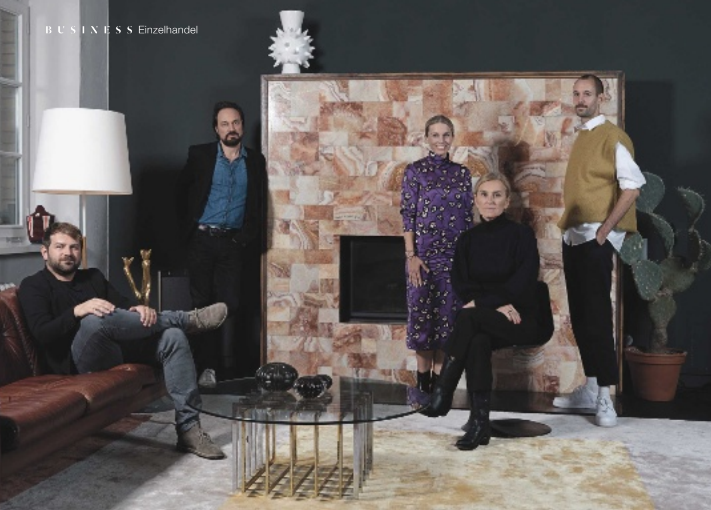
Haare/Make-up: Sven Bensemann/Bigoudi; Fotoassistenz: René Tornemann