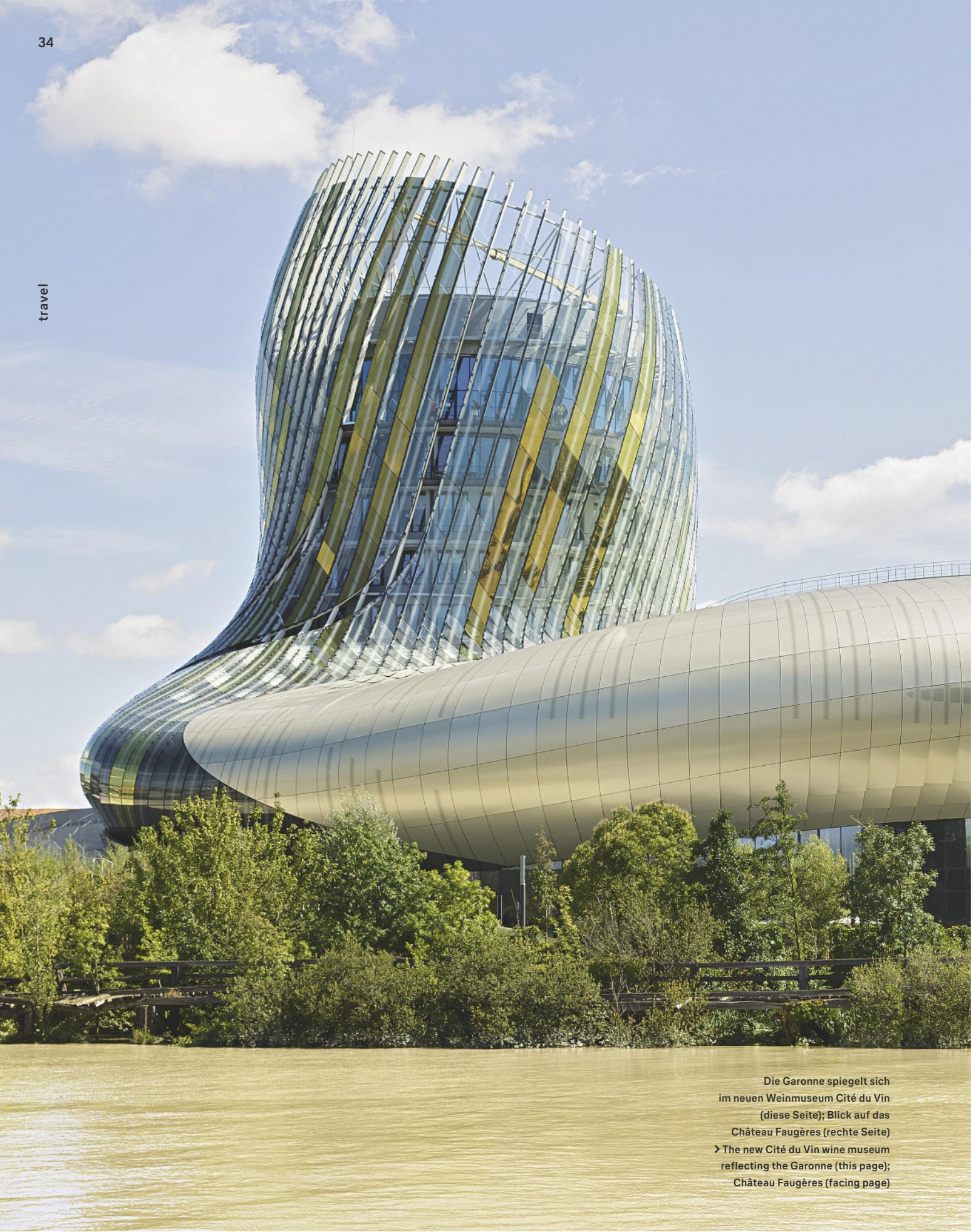
Die Garonne spiegelt sich im neuen Weinmuseum Cité du Vin (diese Seite); Blick auf das Château Faugères (rechte Seite) > The new Cité du Vin wine museum reflecting the Garonne (this page); Château Faugères (facing page)