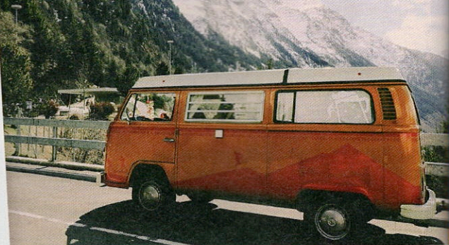
Lieblingsziel: der Prager Wildsee in Südtirol