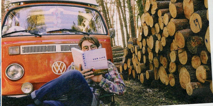
Am liebsten fährt der junge Wahlberliner raus in die Natur, um zu lesen und die Stille zu genießen