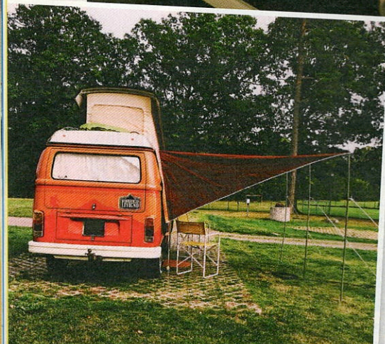
Selten: Das Westfalia-Aufstelltdach wird beim VW T2a und T2a/b hinten hochgeklappt und nicht vorn wie bei seinen Nachfolgern