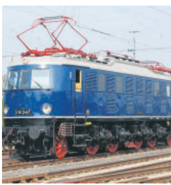
Sonderzug nach Leipzig: Barwagen mit Glühweinstand.

Der Leipziger Weihnachtsmarkt liegt eingebettet in die historische Kulisse der Altstadt. Neben den kulinarischen Genüssen ist bei den Besuchern vor allem der Weihnachtsschmuck