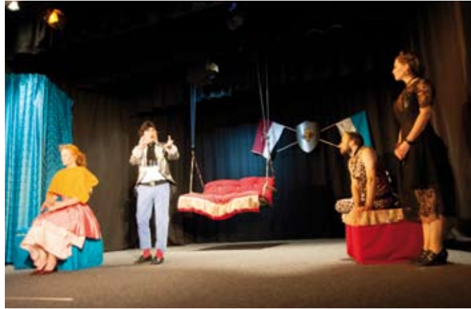
Ein verarmtes Königreich, eine gutmütige Stiefschwester, eine geizige Fee: „Die Prinzessin in der Krise“ unterläuft alle Märchenklischees.

Z u den wenigen verlässlichen Dingen auf der Welt gehört die Tatsache, dass an einem Novemberabend in München die Sonne nicht scheint, schon gar nicht im Pfarrsaal St. Wolfgang im Stadtteil Haidhausen, bei geschlossenen Jalousien. Und doch singen sie: „Überall auf der Welt scheint die Sonne.“ Aber so sind sie halt, die Kölner, beziehungsweise die Südtiroler, beziehungsweise die Südtiroler aus Köln. Die Südtiroler aus Südtirol dagegen freuen sich eher still an ihren Speckbrettln. Deren Duft weht sanft bis hinter den Vorhang, der sich in wenigen Minuten öffnen wird. Und dort drängen sich die Südtiroler aus München, je zwei haben sich zusammengefunden und blaffen sich an: „Ich hasse dich“, säuseln „ich liebe dich“. Immer wieder: Ich liebe dich. Ich hasse dich. Ich liebe dich.