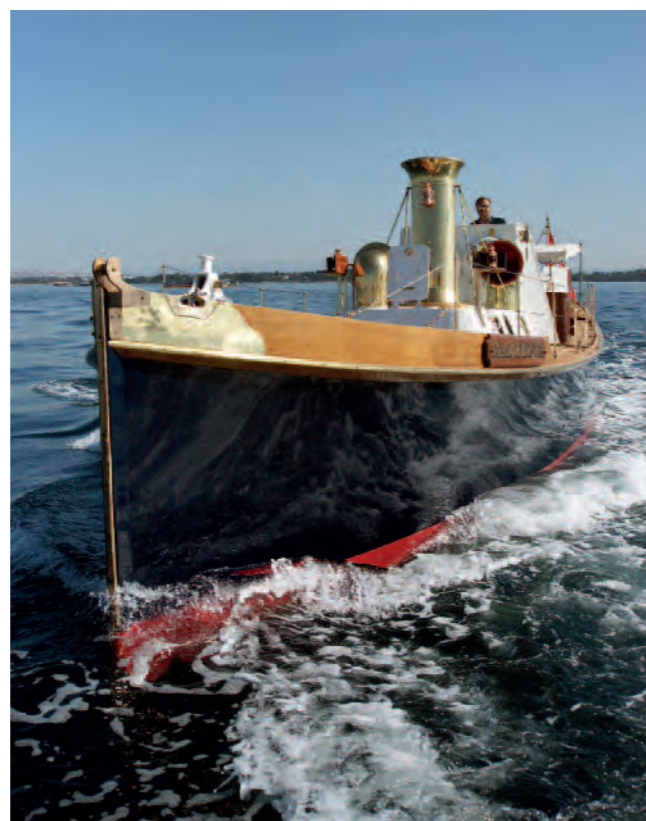
T BRUNO CIANCI / ANNA KAROLINA STOCK