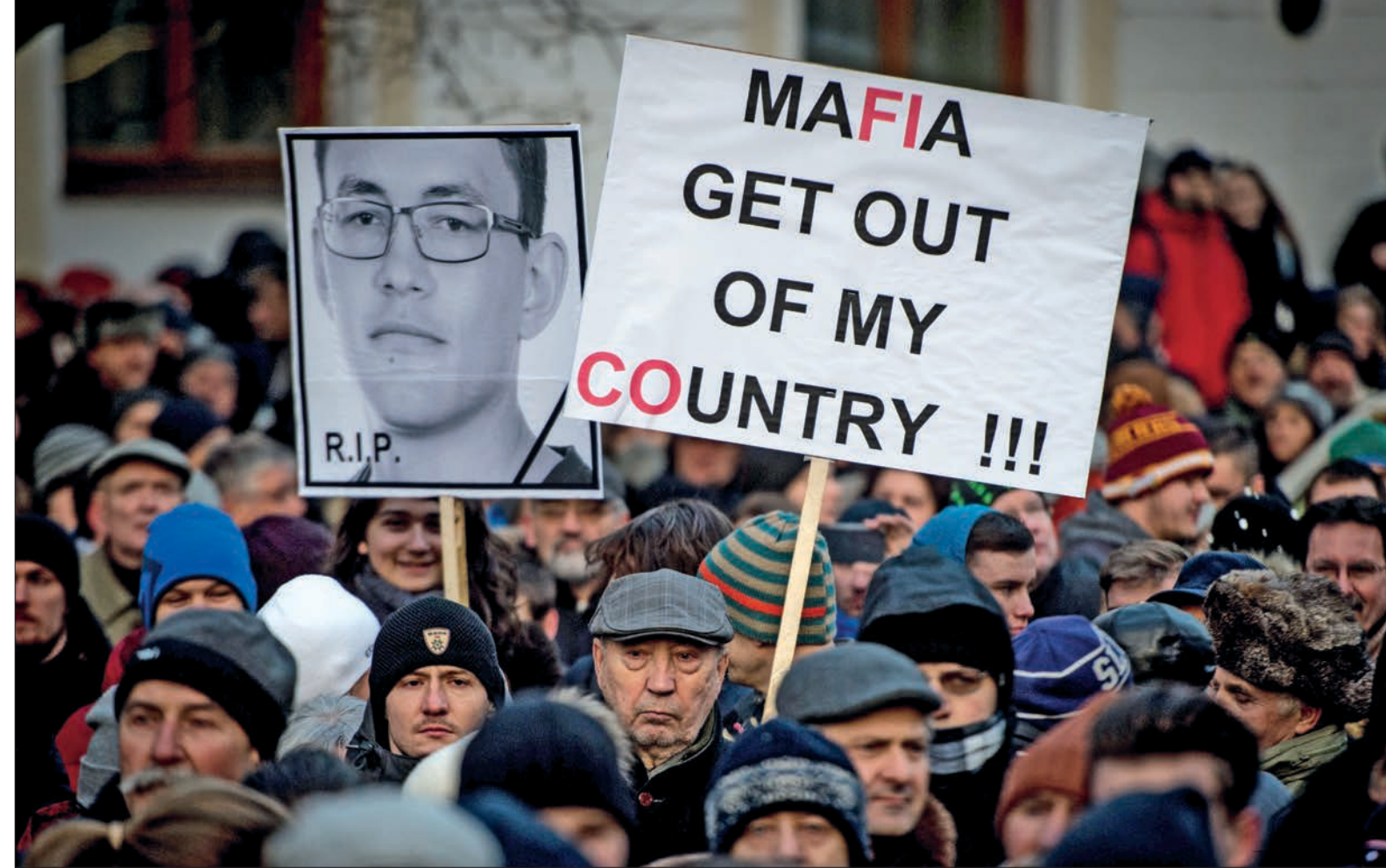
PROTESTMARSCH IM GEDENKEN AN JÁN KUCIAK UND MARTINA KUŠNÍROVÁ Die Hintergründe des Doppelmordes sind noch lange nicht vollständig aufgeklärt.