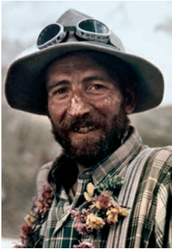
Keine Frage, er war ein Ausnahmebergsteiger. Aber hätte Hermann Buhl den Nanga Parbat auch ohne Amphetamine im Alleingang geschafft?