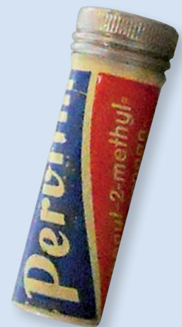
Röhrchen mit Pervitin-pillen anno 1939. Das Robert-Koch-Institut weiß: Heute ist der Amphetamin-Konsum unter Freizeitsportlern wieder am Steigen.