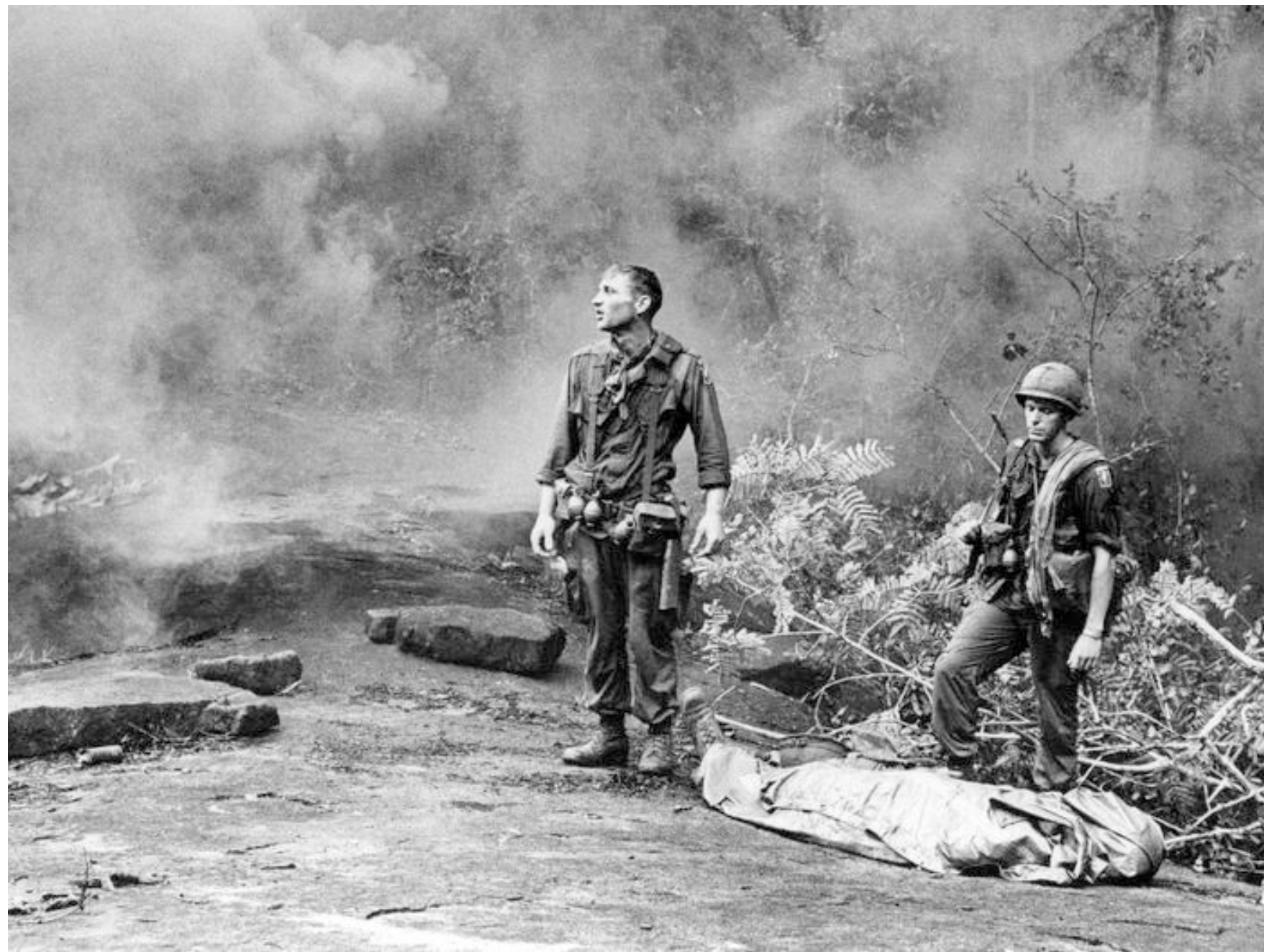
Oktober 1966: Zwei amerikanische Soldaten warten auf den Hubschrauber, der einen toten Kameraden ausfliegen soll

Kann der legendäre Dokumentarfilmer Ken Burns Amerikas schwerste Wunde heilen? Achtzehn Stunden dauert sein Monumentalwerk über den Vietnamkrieg. Nun läuft es auf Arte