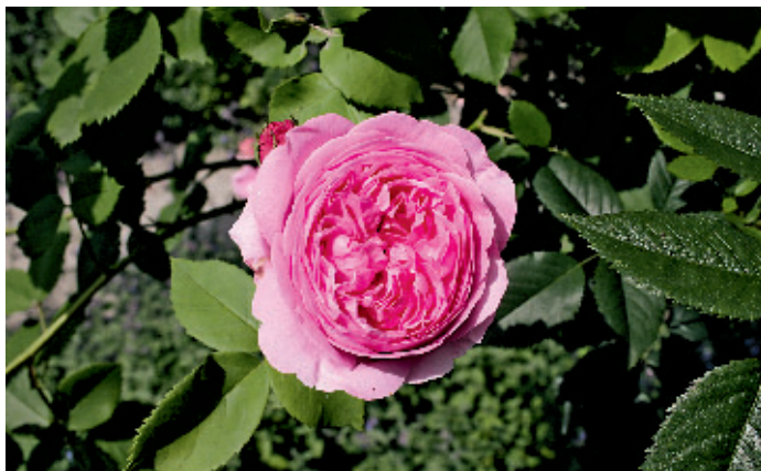
Die stark gefüllten Blüten von 'Louise Odier' duften intensiv. Die Sorte remontiert.