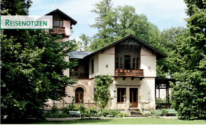
Der schlichte Bau des Casinos mit Aussichtsturm, Terrasse, Balkonen und Loggia besitzt eine Fülle architektonischer Details.