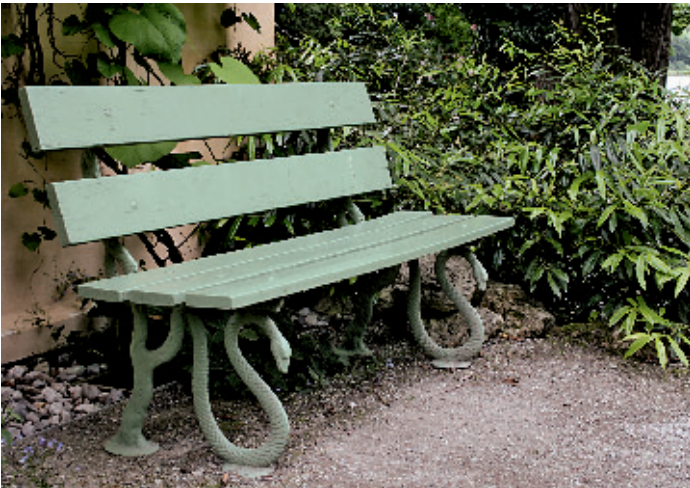
Die Bänke mit Schlangemotiv stellen Abgüsse der historischen Sitzgelegenheiten dar. Sie stehen rund ums Casino.

1970 erwarb der Freistaat Bayern den 2,56 Hektar großen Besitz, der bauliche Zustand wurde als „äußerst schlecht“ eingestuft. Ab 1997 führte die Bayerische Schlösserverwaltung Maßnahmen zur Erhaltung und Restaurierung durch. Nach der Komplettanierung erstrahlen die Wandmalereien im Casino wieder im alten Glanz. Das ehemalige Gärtnerhaus wurde zurückgebaut. Eine Giebelseite zeigt jetzt wieder die Mauer der ehemaligen Kapelle, das Haus beherbergt ein kleines Museum.