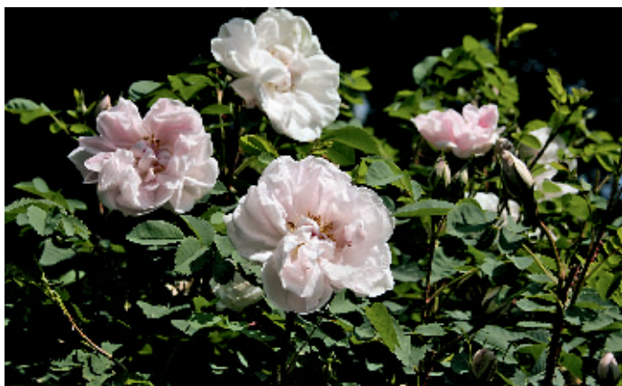
Üppig und den ganzen Sommer hindurch blüht 'Stanley Perpetual' an tief herabhängenden, weichen Trieben.