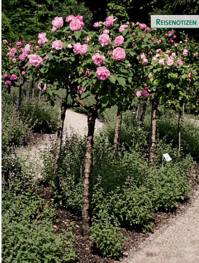
Die robuste Bourbonrose 'Honorine de Brabant' mit ihren gestreiften Blütenblättern duftet gut und remontiert.

Nach Ludwigs II. Abdankung und Tod 1886 verwilderte die Insel zusehends, 1888 wurde die Gärtnerstelle gestrichen. Zwar hatte man die Rosenpflanzung zu Beginn des 20. Jahrhunderts noch einmal erneuert, doch der Verfall ging kontinuierlich weiter.