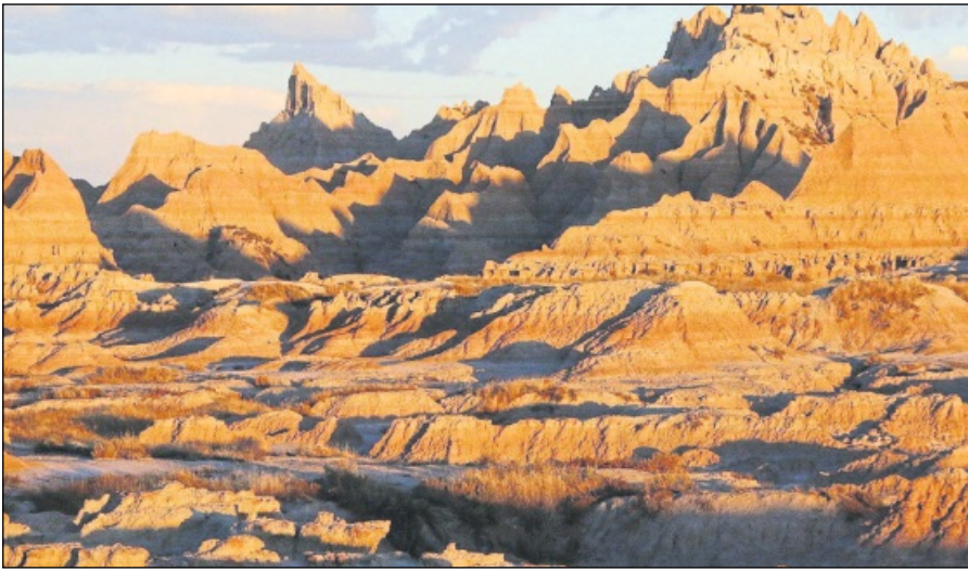
VON WIND UND WASSER GEFORMT: Der Badlands-Nationalpark im Südwesten South Dakotas ist eine spektakuläre Landschaft.

und die American Prairie Foundation streben an, Farmland zwischen bereits bestehenden Schutzgebieten in Korridoren für Bisons und andere Arten wie Gabelböcke und Wapitihirsche umzuwandeln. So könnten die Tiere in ferner Zukunft einmal wieder ihre alten Wanderbewegungen aufnehmen.