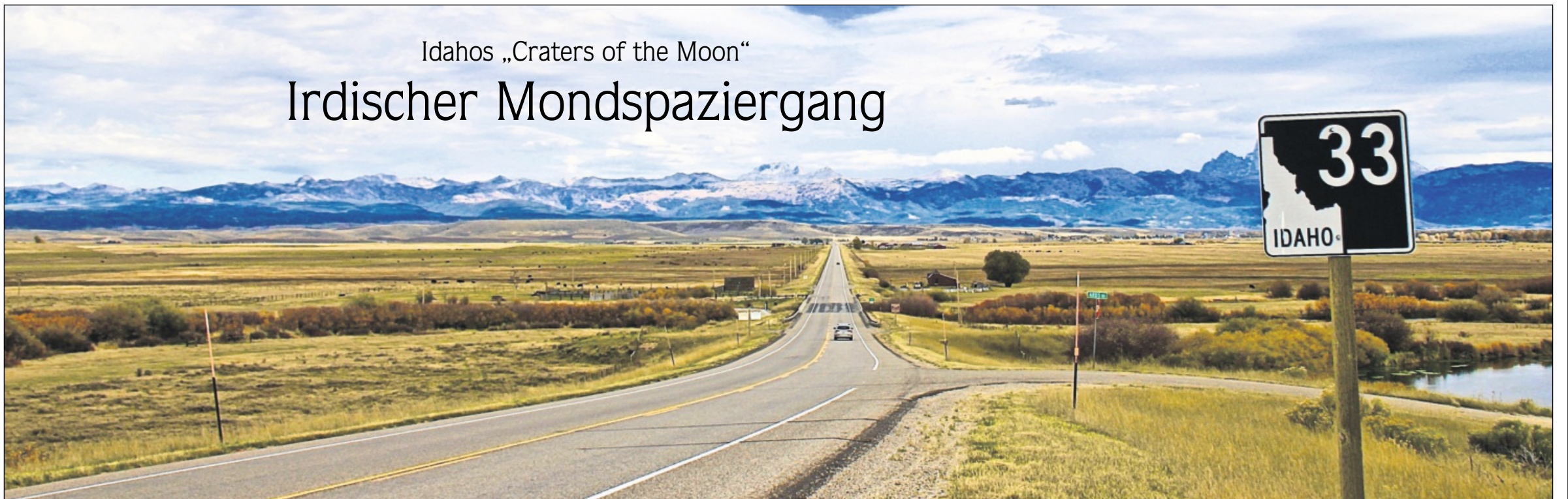
EINSAM UND VERLOREN: Idaho zählt zu den dünn besiedelten Bundesstaaten der USA. Hier, im „Craters of the Moon“ mit seinen großflächig erkalteten Lavaströmen und den Schlackenkegeln, haben NASA-Astronauten für die Mondlandung geübt.

Der Wilde Westen hat viele Geschichten geschrieben. Die der Raumfahrt ist ein Mosaiksteinchen davon: „Ein kleiner Schritt für einen Menschen, ein großer Schritt für die Menschheit.“ Tatsächlich könnten die berühmten Worte Neil Armstrongs inmitten des erkalteten Lavagesteins der „Craters of the Moon“ im US-Bundesstaat Idaho erdacht worden sein. Präsident Nixon schickte 1969 Astronauten in dieses Areal, dessen Pfade 100 Jahre zuvor noch von Goldrausch, Indianern und Wild West-Romantik gesäumt waren – zur Identifizierung von vulkanischem Gestein, wie es auf dem Mond zu erwarten war. Kürzlich hat die amerikanische Weltraumbehörde NASA ein 3D-Modell der Gegend erstellt, Vorausplanung für eine Marsmission. Denn die Oberflächenbeschaffenheit des Landstrichs ähnelt der des Roten Planeten.