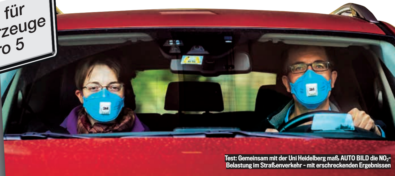
Test: Gemeinsam mit der Uni Heidelberg maß AUTO BILD die NO 2 -Belastung im Straßenverkehr - mit erschreckenden Ergebnissen

MANN, IST DAS ÄRGERLICH! Wer sich vor zwei Jahren in Stuttgart einen neuen Diesel gekauft hat, darf im kommenden Jahr nicht mehr in die Stadt fahren. Das angekündigte Fahrverbot für Diesel bis Euro 5 trifft den Großteil der Dieselfahrer in Deutschland.