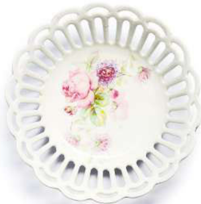
Maximilian Becker benutzt noch heute die Porzellanschale des Freundes der Urgrossmutter.