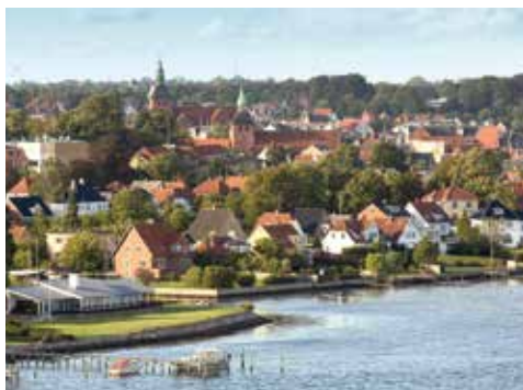
Oben: Küstenlandschaft am Svendborg Sund, unten: Kunstmuseum Brandts Kledefabrik in Odense.