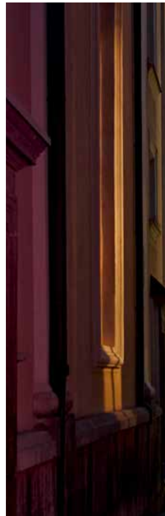
Von links oben im Uhrzeigersinn: Hotel Celica, Seitengasse bei der St.-Nikolas-Kirche, Hotel Vander Urbani Resort, Restaurant Gostilna na Gradu.

Barockfassaden und Kopfsteinpflastergässchen, romantische Brücken und eine mächtige Burg, die über der Altstadt thront: Ljubljana kann in Sachen pittoresker Postkartenmotive locker mit Prag oder Budapest mithalten. Und weil in der Altstadt der Autoverkehr stark limitiert ist, bleibt umso mehr Platz für viele Straßencafés und Restaurants, was Ljubljana eine fast mediterrane Atmosphäre verleiht. Gut essen kann man zum Beispiel im urigen Gostilna Na Gradu auf dem Burggelände, wo deftige slowenische Fleischgerichte und lokal produzierter Wein auf der Karte stehen. Was die Unterkünfte angeht, hat Ljubljana übrigens auch für jeden Geschmack etwas zu bieten, von Designhotels wie dem Vander Urbani Resort bis zu kreativen Konzepten: Im Hotel Celica schläft man zum Beispiel in einem ehemaligen Militärfängnis.