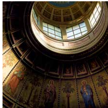
Oben: Kuppel der rumänisch-orthodoxen Stourza-Kapelle, Club Bernstein im Kasino.