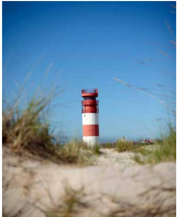
Von oben im Uhrzeigersinn: Hafen im Unterland, Düne mit Leuchtturm, Hummerfischer Detlev Nitze, Schafe auf dem Oberland.