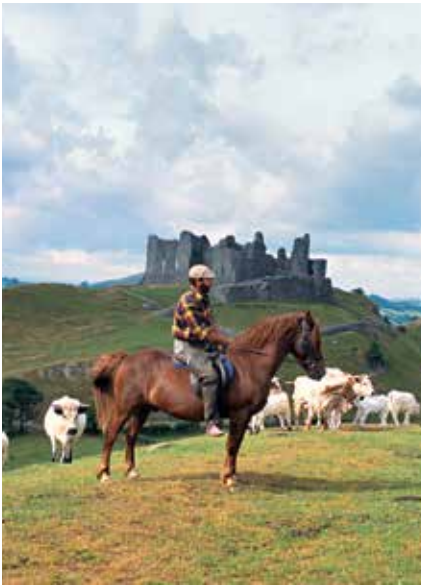
Hirte vor der Ruine von Carreg Cennen Castle bei Llandeilo, Carmarthenshire.

Die keltische Kultur fasziniert jedes Jahr unzählige Besucher – allerdings reisen die vornehmlich nach Schottland oder Irland. Unberührt von Touristenströmen ist Wales, das mindestens genauso viele keltische Kultstätten, Schlossruinen und atemberaubende Natur zu bieten hat. Drei Nationalparks drängen sich in Wales: Brecon Beacons mit verwunschenen Bergpfaden und Ruinen wie dem Carreg Cennen Castle , Snowdonia, benannt nach Wales' höchstem Berg Snowdon (1.085 Meter), und Pembrokeshire Coast. Während die ersten beiden mit Bergketten und grünen Hügeln zum Wandern einladen, ist der Pembrokeshire Park ein Küstengebiet, das mit Sandstränden und Steilküsten aufwartet. Rund um die Parks liegt ein Flickwerk von kleinen Dörfchen, die aussehen wie aus dem Bilderbuch, zum Beispiel Hay-on-Wye , das als Bücherdorf bekannt ist. Große Städte gibt es dagegen fast keine in Wales, die Hauptstadt Cardiff bleibt mit ihren 350.000 Einwohnern gemütlich und überschaubar.