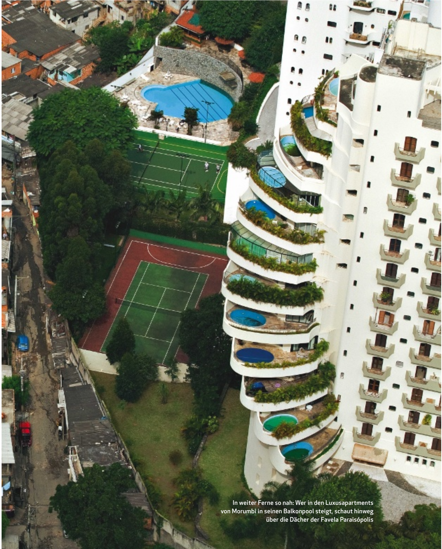
In weiter Ferne so nah: Wer in den Luxusapartments von Morumbi in seinen Balkonpool steigt, schaut hinweg über die Dächer der Favela Paraisópolis