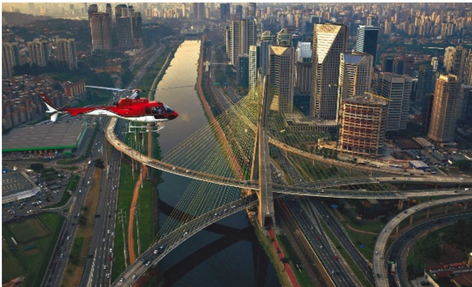
Die Estaiada-Brücke an der Umgehungsautobahn, dahinter die Türme des Bankenviertels von Brooklin. Ein Ausschnitt aus der urbanen Hochdruckzone. Zwischen den fast sieben Millionen Autos: die Motorradkurier. Fast 300 von ihnen verunglücken jedes Jahr tödlich