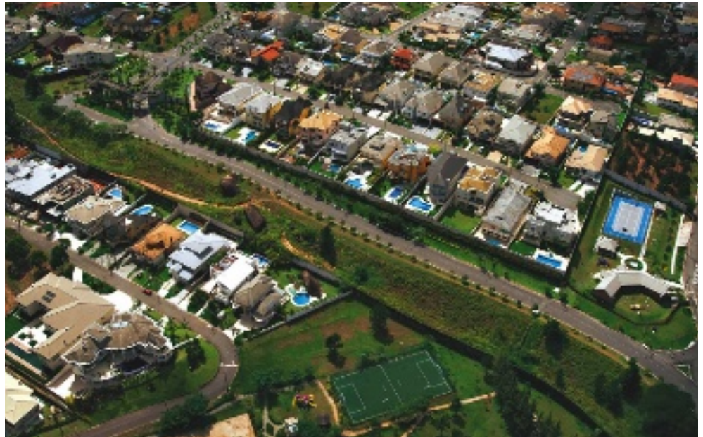
Hier wird es ganz teuer: eine Villengegend im Westen der Stadt. 21 Milliardäre wohnen in São Paulo, der zehntstärksten Wirtschaftsmetropole unseres Planeten

Unten, in der Favela, lassen junge Männer ihre Motorräder heulen, sie tragen keine Helme, fahren viel zu schnell. „Das sind die bösen Jungs“, sagt do Car-