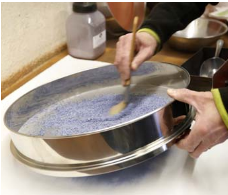
Edel-Stein: Ein Kilogramm Fra-Angelico-Blau kostet rund 16 000 Euro.