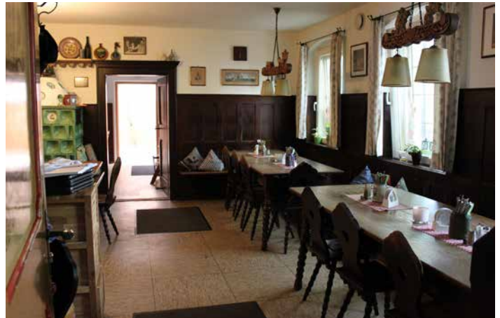
Das Bräustüberl befindet sich gleich neben der Brauerei. Im Sommer sitzt man im schattigen Garten, im Winter im gemütlichen Stüberl und genießt zum Bier Weißwürst, Brotzeit oder Braten. Jeden Sonntag ist Weißbierbrunch