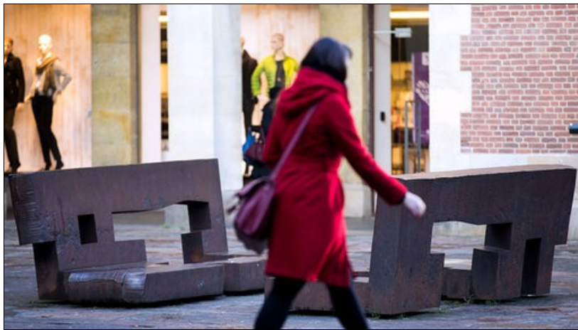
Die Bänke des Künstlers Eduardo Chillida im Rathausinnenhof in Münster

Was passiert mit der Portigon-Kunstsammlung? Dazu steht am Donnerstag (05.02.2015) ein Spitzentreffen in Düsseldorf mit Politikern, Kunstexperten und Bankern an. Kulturstaatsministerin Monika Grütters (CDU) hat die Debatte maßgeblich geprägt. Im WDR erklärt sie, warum sie gegen ein Verkaufs-Tabu ist.