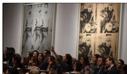
Warhol-Auktion im November in New York

Grütters: Ich muss nicht dabei sein. Wir kennen alle Akteure, die am 5. Februar zusammen kommen. Ich hoffe nur, dass nicht hinter verschlossenen Türen verhandelt wird, sondern dass man sich endlich zu einer transparenten Strategie entscheidet.