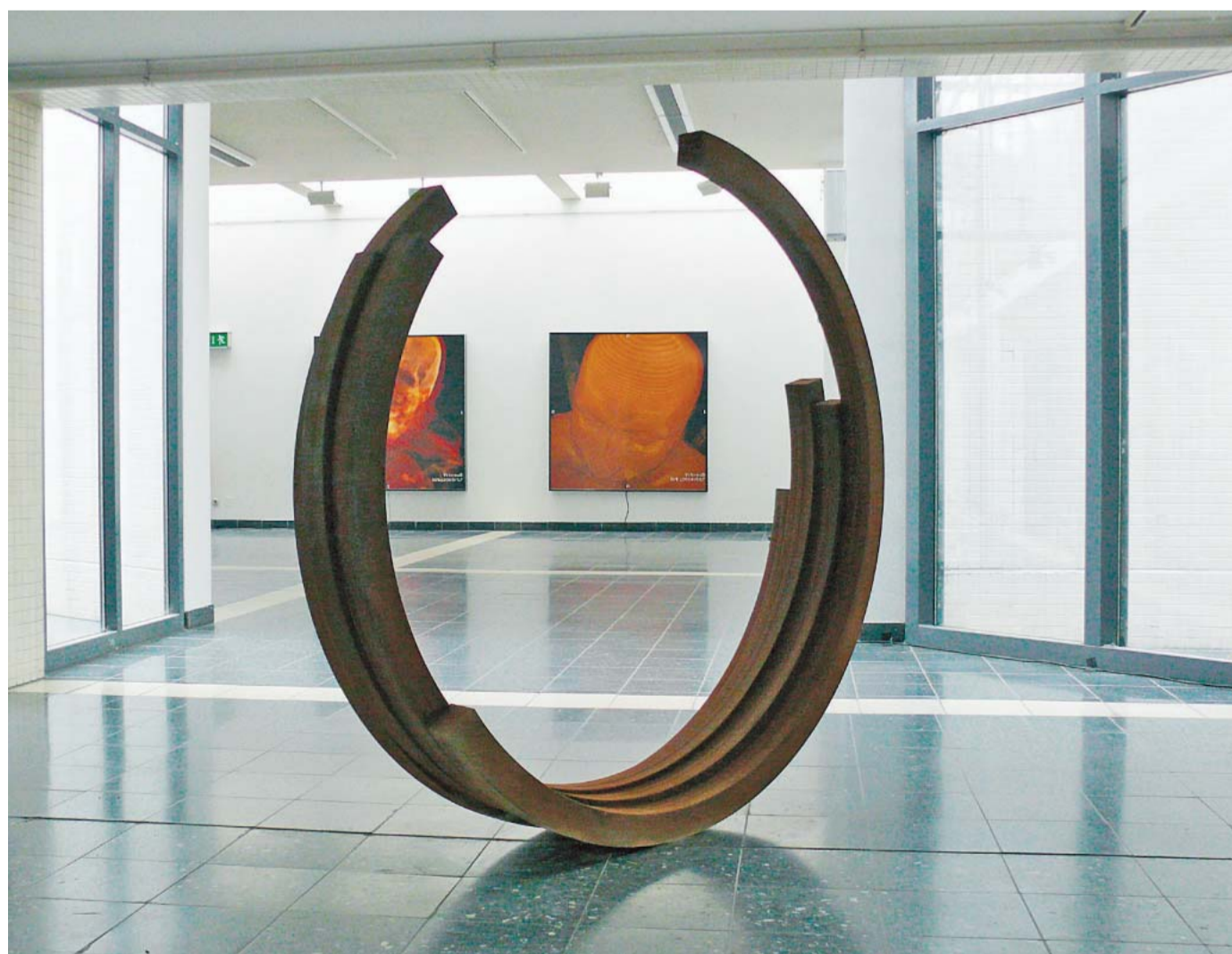
Lapidarer Titel: Bernar Venets „229,5° x 4“ in der Kunsthalle