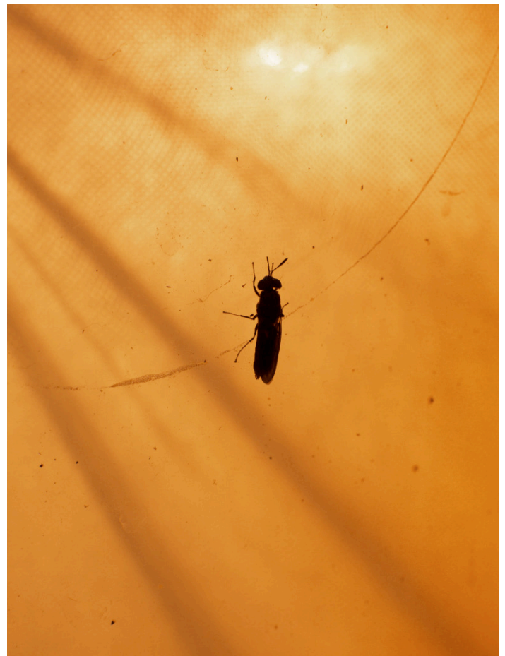
Der Hoffnungsträger: die Schwarze Soldatenfliege. Links: Die Eierlarven wachsen auf einem Nährboden heran. Das Tabakblatt sorgt für Feuchtigkeit