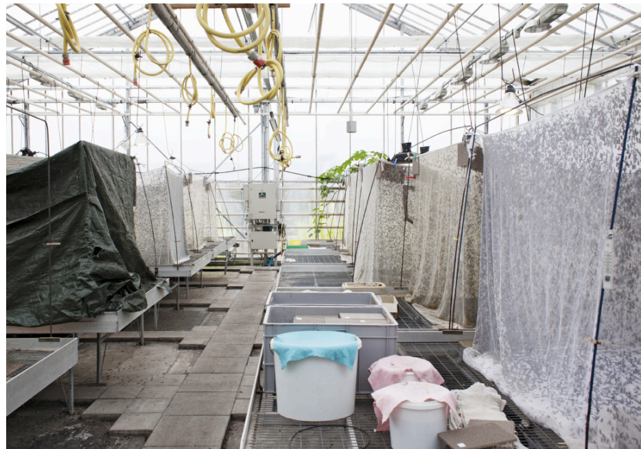
Die Kinderstube: In den Netzen legen die Fliegen ihre Eier ab

Für eine Massenhaltung spricht außerdem, dass die Tiere harmlos und genügsam sind. Die erwachsenen Fliegen können weder beißen noch stechen, da sie keine Mundwerkzeuge und