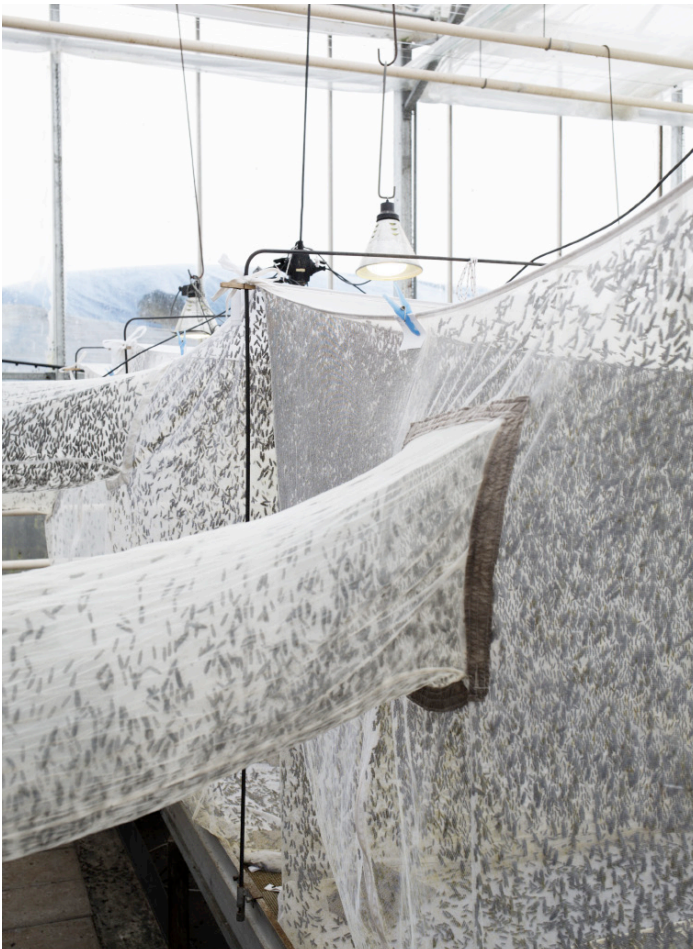
Die Masse macht's: die Schwarze Soldatenfliege, made in Brandenburg