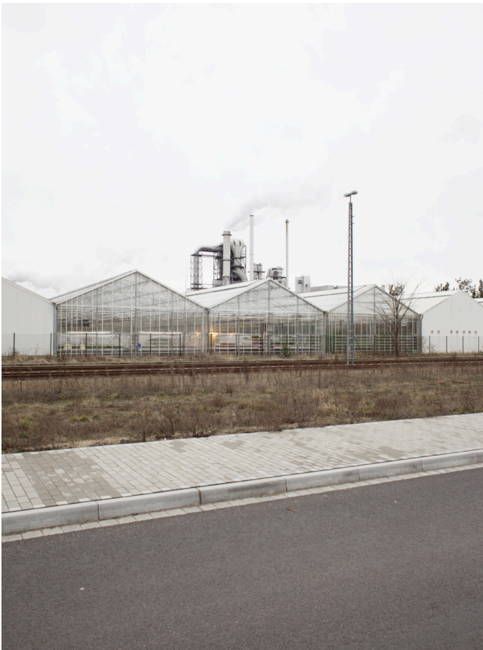
Die Insektenzucht: dahinter ein Holz verarbeitender Betrieb, der Wärme liefert

Aas und Fäkalien. Auch das macht sie interessant: Wie eine lebende Recycling-Maschine kann die Fliegenlarve organische Abfälle in hochwertiges Eiweiß verwandeln, das als Insektenmehl in die Nahrungskette zurückgeführt werden kann.