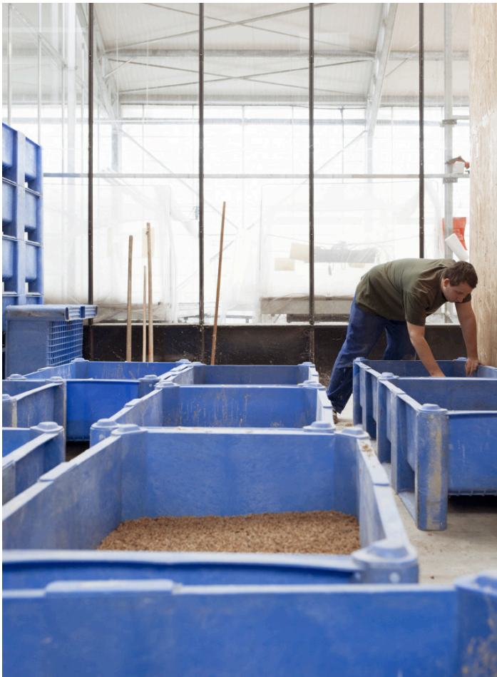
Gut entwickelte Larven, rechts aus der Nähe zu sehen