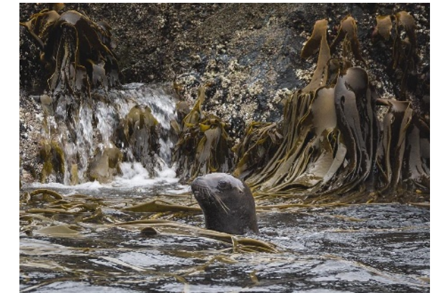
Links: Rückkehr vom Kap Hoorn aufs Mutterschiff. Oben: An der Küste tauchen Seehunde auf. Unten: Nach dem Landgang kommt der Eisschollen-Slalom