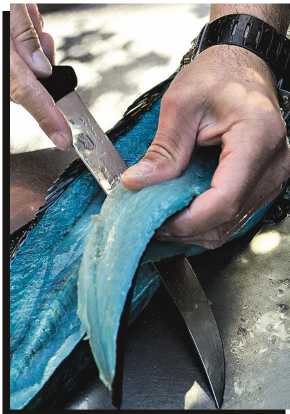
Blauer Fisch? Meeresbiologen rätseln. Manche Lengdorsche haben wohl Pigmente im Blut, die ihr Fleisch verfärben. Oder einfach zu viele Tintenfische verspeist

dahin, wo die Fische sind“, antwortet er, als ich ihn frage, warum wir ausgerechnet im Jagdgebiet Weißer Haie speerfischen müssen. „Aber man darf sein Glück nicht herausfordern.“ Das Risiko, selbst gefressen zu werden, minimiert er, indem er immer an anderen Stellen taucht – und höchstens einmal pro Woche. „Wenn ein Hai in der Nähe ist, spüre ich ihn“, sagt er und meint das ernst. „Ich habe eine besondere Verbindung zum Meer.“