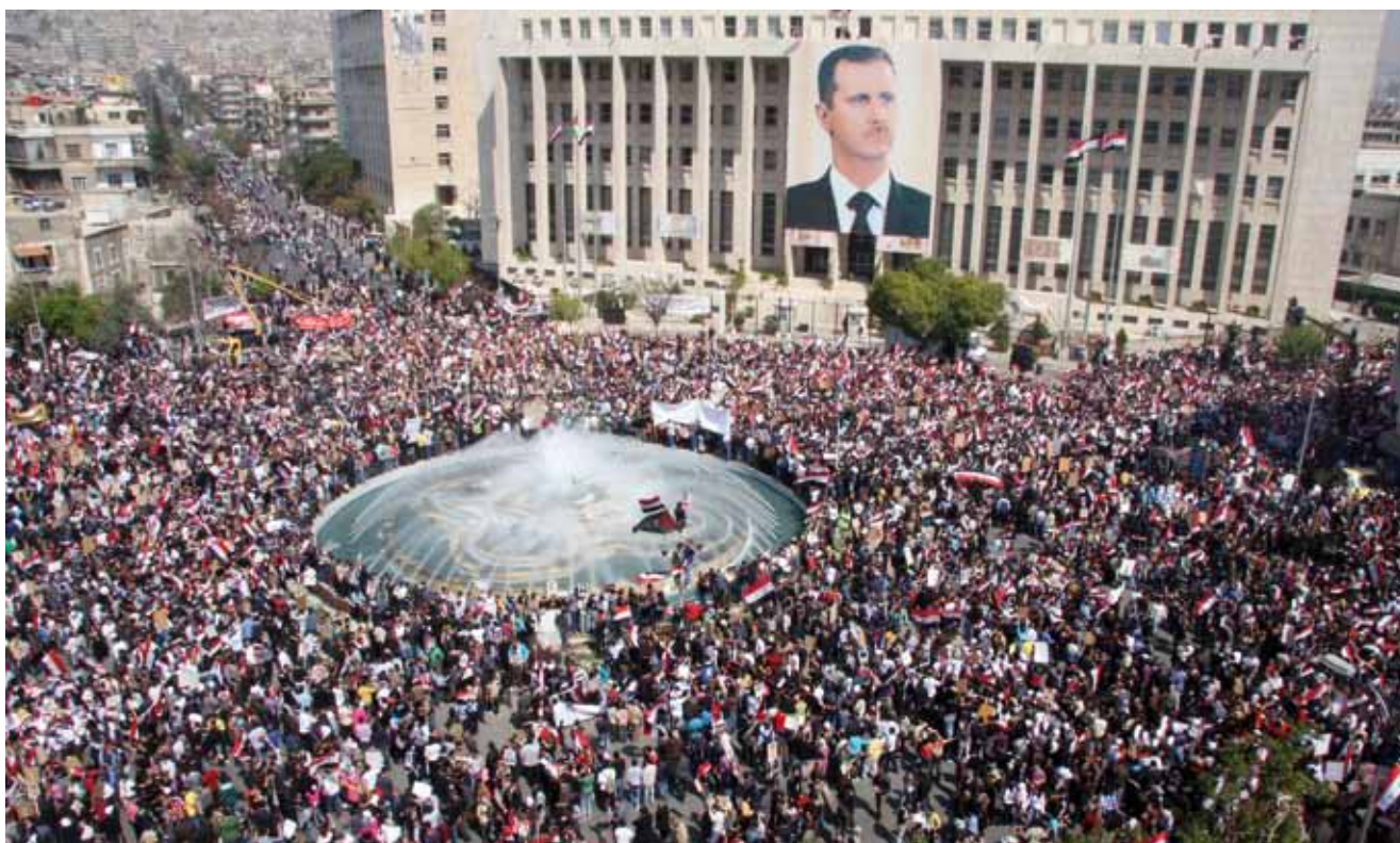
Demonstration für Assad, Damaskus 2011

schaft und der sozialen Ungerechtigkeit galt seither vielen Bashar al-Assads Cousin Rami Makhlouf, der im Jahr 2011 einer Schätzung der Financial Times zufolge durch ein komplexes System an Beteiligungen sechzig Prozent der syrischen Wirtschaft kontrollierte. 34