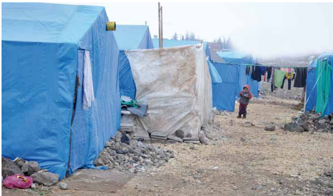
Flüchtlingslager in Kilis an der syrisch-türkischen Grenze

tät vertreten sind. In den vergangenen Jahrzehnten war wie in vielen Ländern der Region eine zunehmende Rückbesinnung der muslimischen Bevölkerung auf die Religion zu verzeichnen: Während beispielsweise in den frühen 1980er Jahren lediglich eine Minderheit der Damaszener Frauen den Hejab oder eine andere islamische Bedeckung trug, war es im Jahr 2006 bereits eine Mehrheit. 18 Neben den Sunniten gibt es in Syrien eine schiitische Minderheit von etwa zwei Prozent; die Hälfte von ihnen gehört der Glaubensrichtung der Ismailiten an. 19 Abseits des muslimischen Glaubensspektrums gibt es christliche Syrerinnen und Syrer verschiedener Konfessionen (etwa zehn Prozent der Bevölkerung), einige tausend Jesiden, die vornehmlich in