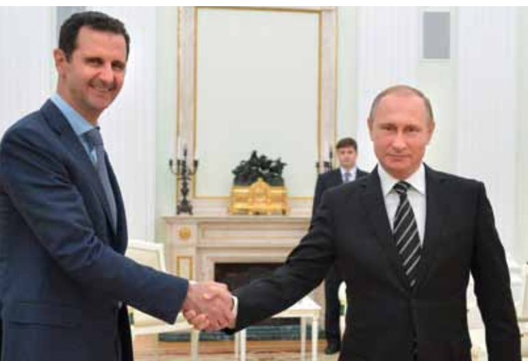
Besuch des syrischen Präsidenten beim russischen Präsidenten Wladimir Putin, Kreml, 20. Oktober 2015