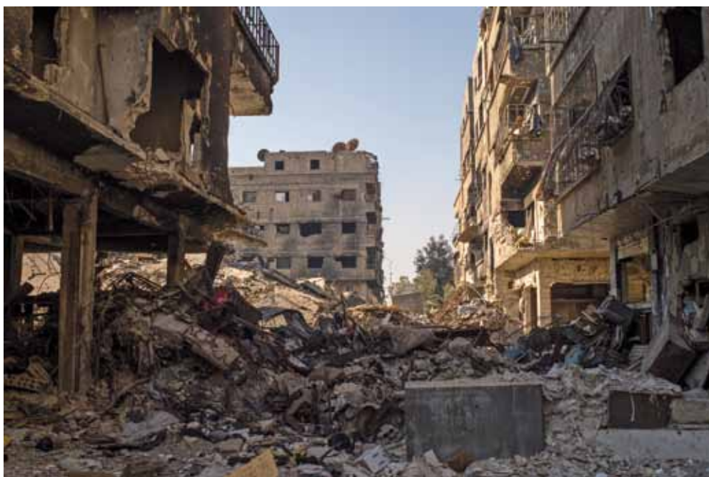
Zerstörter Häuserzug in Damaskus, 26. Dezember 2015

diese würden das syrische Regime und die Kurden bekämpfen, mit deren Unabhängigkeitsbestrebungen die Türkei bekanntermaßen selbst beschäftigt ist. In der Tat war eher festzustellen, dass Assad und der IS sich lange stillschweigend duldeten – während sich jeder erst einmal um andere Gegner „kümmerte“. Gegen die Kurden jedoch blieb der IS nur mäßig erfolgreich. Das Kalkül Ankaras ging auch insbesondere deshalb nicht auf, weil sich die Aktivitäten des IS bald auch im eigenen Land bemerkbar machten: Er bekannte sich zu mehreren Terroranschlägen in der Türkei.