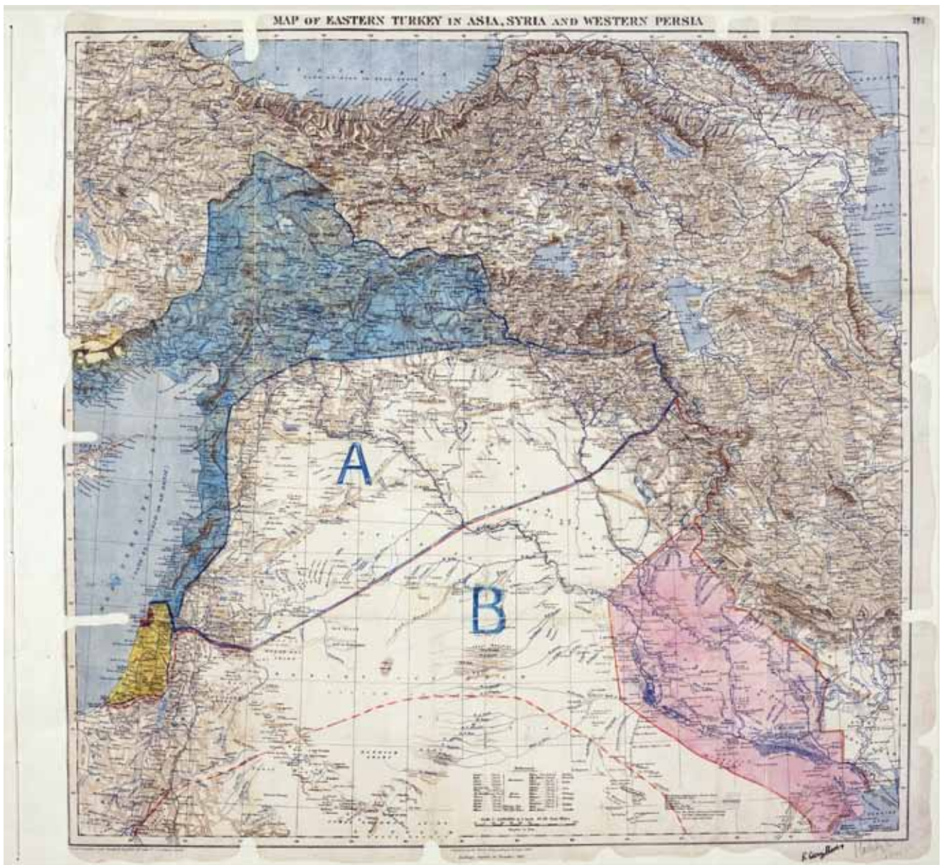
Die historische Karte des Sykes-Picot-Abkommens

wahrsten Sinne des Wortes mit dem Lineal gezogen. Die syrischen Staatsgrenzen sind nicht historisch gewachsen, sie entspringen einem Abkommen, das im November 1915 von dem französischen Diplomaten François Georges-Picot und dem Briten Mark Sykes ausgehandelt und im Mai 1916 ratifiziert wurde. Darin wurde bereits das Fell des Bären zerteilt, den es erst noch endgültig zu erlegen galt: Die Diplomaten teilten das Gebiet des im Ersten Weltkrieg zerfallenden Osmanischen Reichs in koloniale Einflussphären auf. Syrien, davor ein Teil des arabischen Ostens im osmanischen Vielvölkerstaat, wurde neben der Südost-Türkei, dem Nordirak und dem Libanon den geschickt verhandelnden Franzosen zugesprochen.