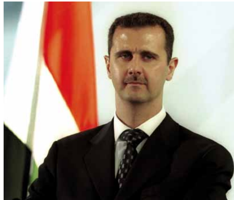
Bashar al-Assad

Regimes unmöglich machen sollten. Oder, in den Worten eines syrischen Alawiten: „Um Syrien zu beherrschen, brauchte Assad die Alawiten, aber nur solange sie ‚seine Alawiten‘ waren. Er konnte sie benutzen, aber nur dann, wenn ihr Dasein allein von ihm abhing; Assad erfand sich als Heiland einer verhassten Minderheit, als ihr Identitätsstifter, Ernährer und ‚raison d’être‘.“ 22 Viele Alawiten binden heute ihre Identität oder zumindest ihr Schicksal an die Assad-Herrschaft: „Wer heute in die Alawitenberge an der syrischen Küste fährt, mag sich auf den ersten Blick wundern: Die Dorfbewohner stehen im Krieg zwar auf Seiten des Regimes, für Bashar al-Assad hegen sie aber wenig Sympathie.“ 23 Doch wie erlangte die Familie Assad in Syrien eine derartige Machtposition?