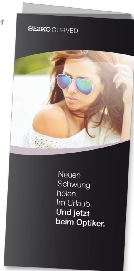
DIN lang Flyer