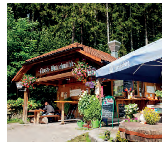
Mitte: Raststation inmitten der Wutachschlucht. Wanderer, Forstarbeiter, Fischer, Jäger holen hier ihre Brotzeit. Neuigkeiten aus dem Schluchtleben gibt es gratis dazu.