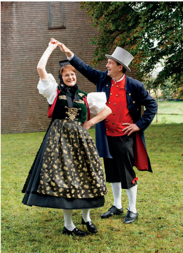
Oben: Volkstänze in Hochschwarzwälder Tracht der Biedermeierzeit pflegt der Löffinger Trachtenverein. In Zylinder, Gehrock und Kniestrümpfen, Haube und Mieder haben die Bauern einst an Festtagen ordentlich gefeiert.