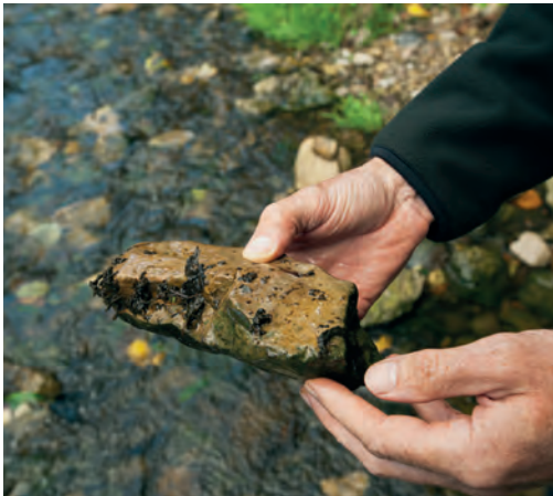
Mitte: Unterseite eines Flusstes, dicht mit Mückenlarven besiedelt. Die Wasserramsel weiß das: Wenn sie Hunger hat, dreht sie die Steine um.