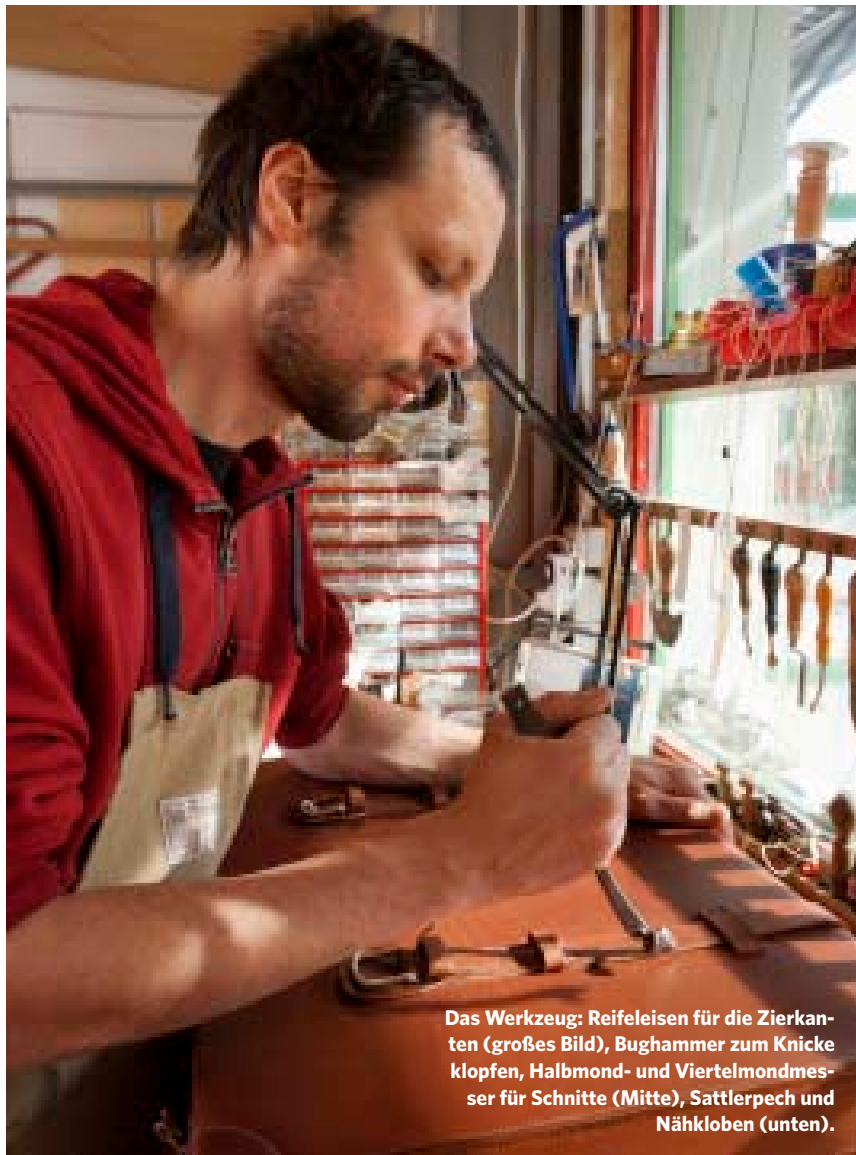
Das Werkzeug: Reifeisen für die Zierkanten (großes Bild), Bughammer zum Knicke klopfen, Halbmond- und Viertelmondmesser für Schnitte (Mitte), Sattlerpech und Nähkloben (unten).