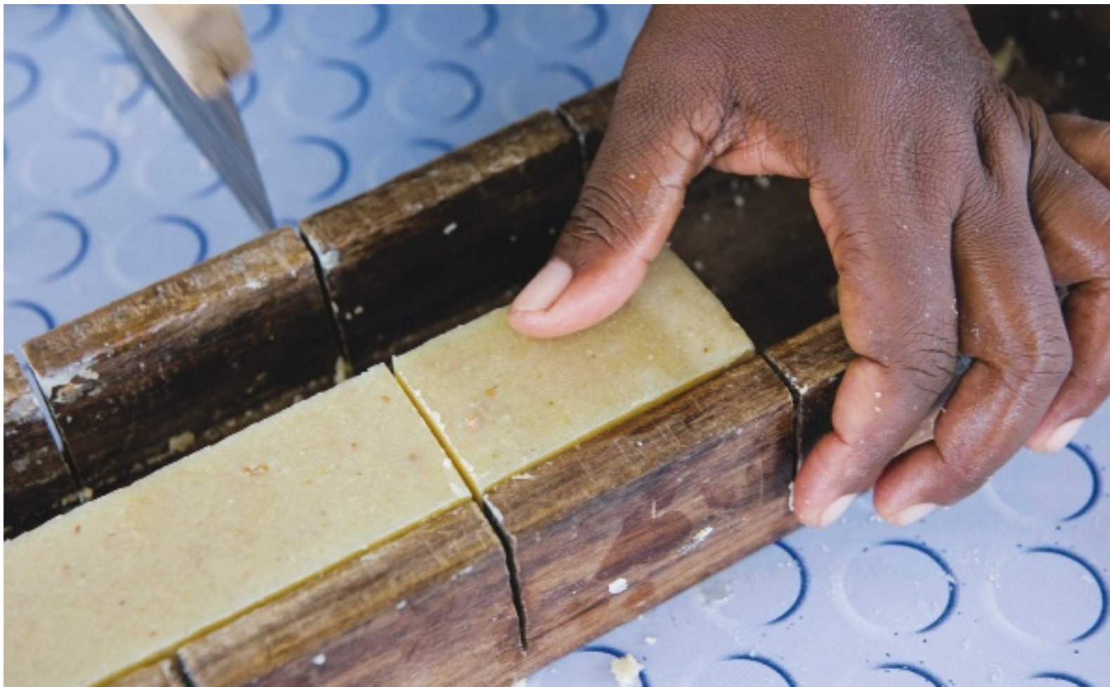
Drei Tage werden die Seifen in Wannen angetrocknet, dann in Holzschienen geschnitten und weitere sechs bis zehn Wochen ausgetrocknet