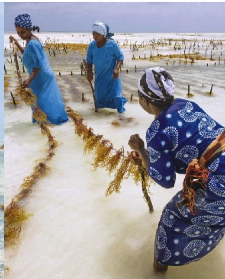
Schnüre spannen in der Mittagshitze ist anstrengend