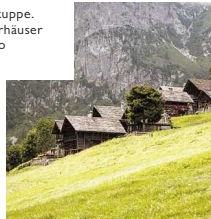
Morgenglicht auf der Signalkuppe. Wälscherhäuser in Otrto

ne und Schnee abzeichnen. Und dann? Dann münden Tausende erklommene Höhenmeter und Wochen der Vorbereitung in diesen einen Augenblick der Ankunft.