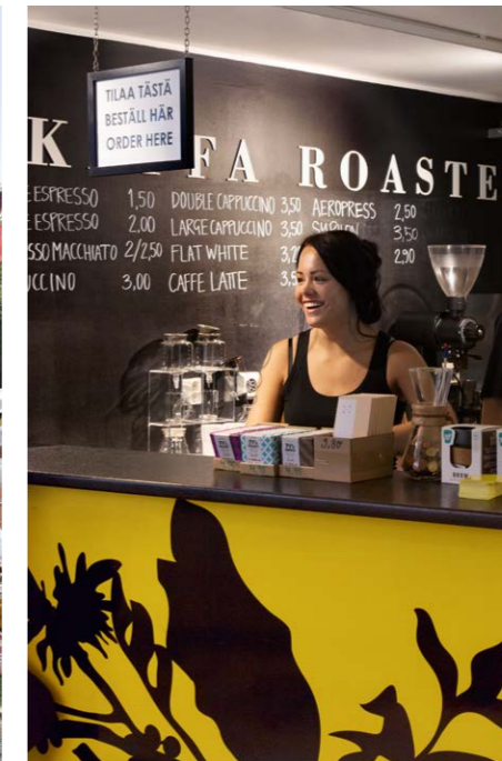
16 KAFFA ROASTERY