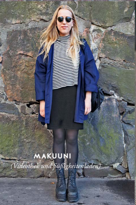
MAKUUNI (Videothek und Süßigkeitenladen)