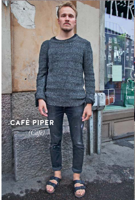
CAFÉ PIPER (Cafe)