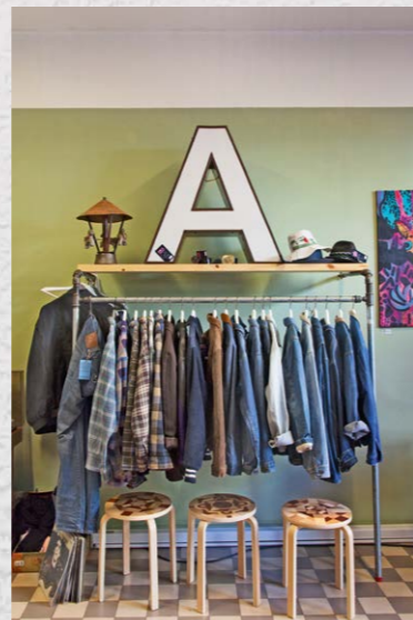
4 SOUL VINTAGE