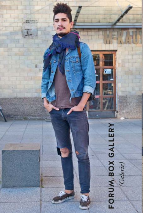
FORUM-BOX GALLERY (Galerie)