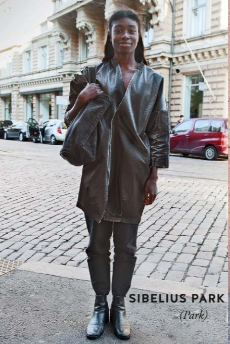
SIBELIUS PARK (Park)