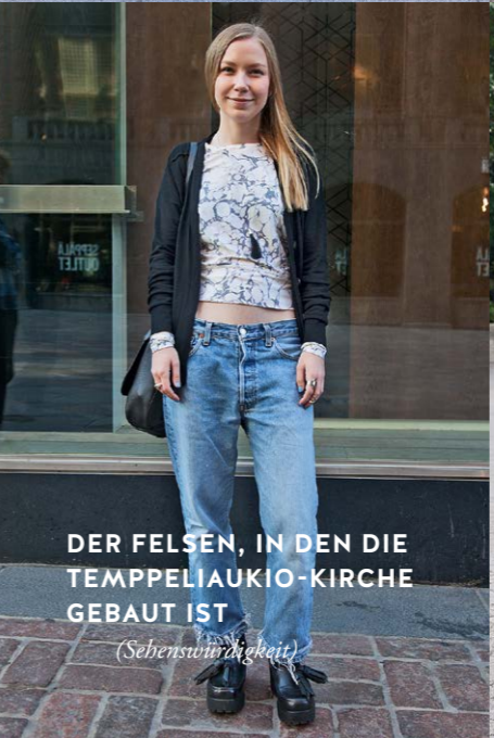
DER FELSEN, IN DEN DIE TEMPELLIAUKIO-KIRCHE GEBAUT IST (Sehenswürdigkeit)