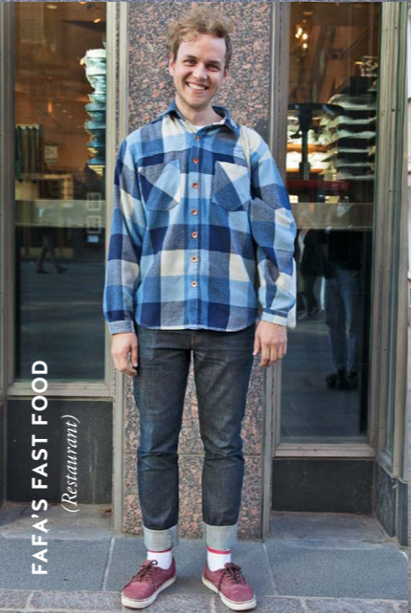
FAPA'S FAST FOOD (Restaurant)