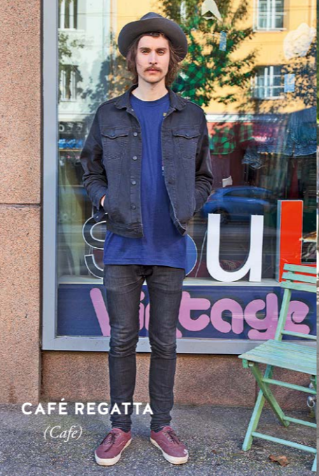
CAFÉ REGATTA (Cafe)