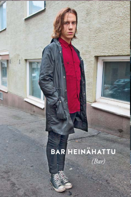
BAR HEINÄHATTU (Bar)