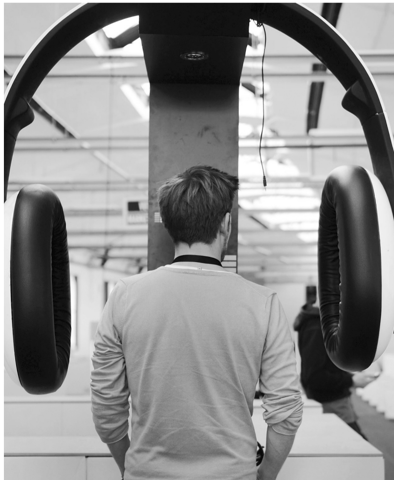
Music-Week-Installation im Postbahnhof

Eines ist aber schon jetzt klar: Zumindest die »Word!«-Konferenz ist einer der Gewinner der Musikwoche. »Wir sind fast überrannt worden von Besuchern«, sagt Döring. Im Vergleich zum letzten Jahr sei die Zahl noch einmal um 1000 Fachbesucher