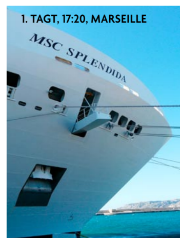
1. TAGT, 17:20, MARSEILLE