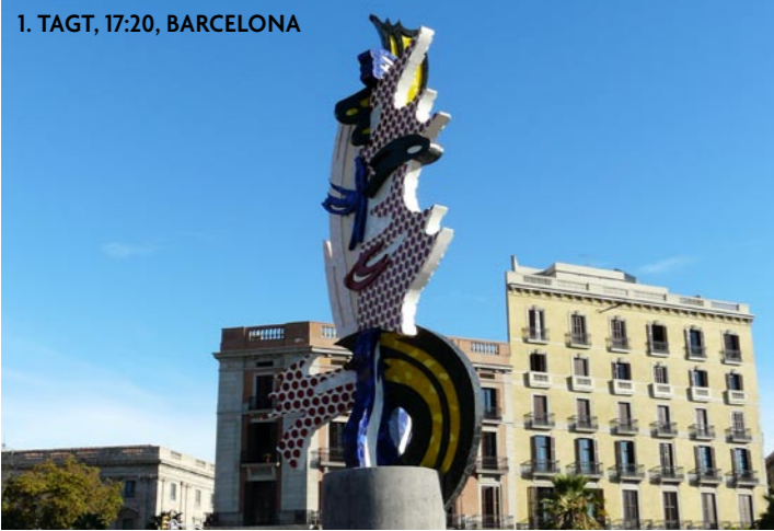
1. TAGT, 17:20, BARCELONA