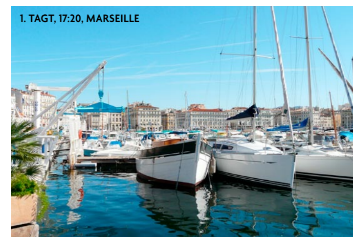
1. TAGT, 17:20, MARSEILLE

Marseille! Skifahrer können direkt von der Piste beim Christkindlmarkt auf der Petzen (Südkärnten) inmitten verschneite verschneiter Gipfel auf r Gipfel auf 1.700 Meter Höhe erstmalig einkehren. Infod weitere Verantstasldfasdfasdfungen gibts und weitere Veranstaltungen gibts auf www.klopeinersee.at