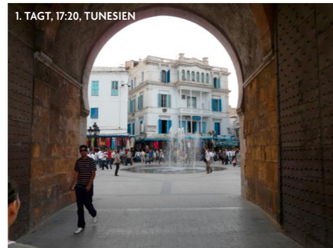
1. TAGT, 17:20, TUNESIEN

revidiu scierdii erte tantis sedit vid faudam ignam asdfasflkqah weröoi auwöelri uasdöfoiuawerölkawefoapwe