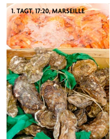
1. TAGT, 17:20, MARSEILLE