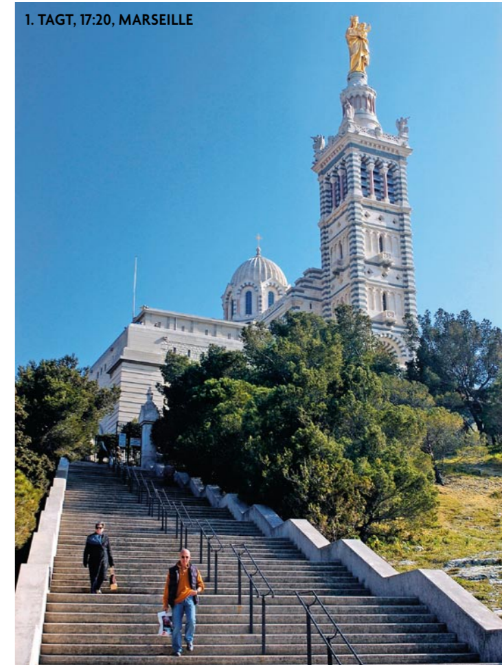
1. TAGT, 17:20, MARSEILLE

1. TAG, GENUA prat. Facil iustrud min ullut velit alisi blandiat, si blandre doloreet in vullandre dolobortie do odolenibh etue velit aut am, vel incing et, conse modolore dolummy niam venit, consed ecte dolore. Modignis dolobor eraessit lor autat. Ut la faccum dolobore duis nonsequi enibhlii tatium haedet