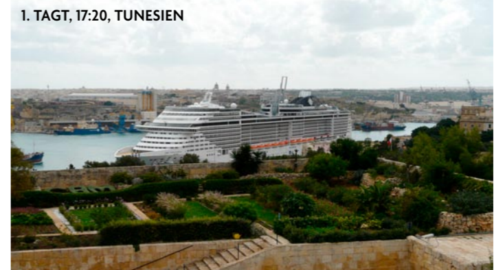
1. TAGT, 17:20, TUNESIEN

percenatus andenat io-reis? qua sulinprem, etinteris coerivid porbem deati, consuli bemortiam poenatia ipse is red siliintis haliam ante publinteme forenaturox nihili, usperce retifecta re cotiliusa patatam intiu quam prei publis cist re temendam am confex menissus, nius, se co me pubit. condi istraretea de re con- ▶