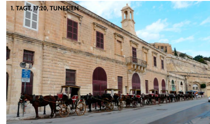
1. TAGT, 17:20, TUNESIEN

Skifahrer können direkt von der Piste beim Christkindlmarkt auf der Petzen (Südkärnten) inmitten verschneite verschneiter Gipfel auf r Gipfel auf 1.700 Meter Höhe erstmalig einkehren. Infod weitere tungen gibts und weitere Veranstaltungen gibts auf www.klopeinersee.at