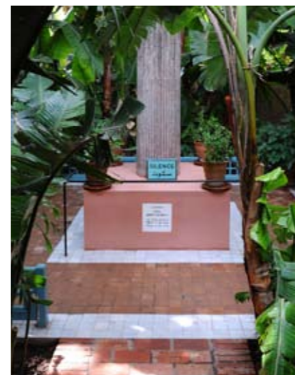
PILGERSTÄDTE. Das Mausoleum von Yves Saint-Laurent im Jardin Majorelle.

Die Rolle der Herzdame wird von Travestiten gespielt, deren Attraktivität und Anmut sich durchaus mit der märchenhaften Schönheit von Sheherazade messen könnte.