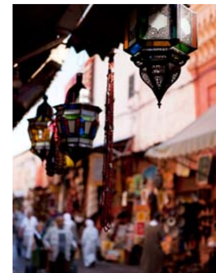
EINZELHANDEL. Tausende Souks (Marktstände & Miniläden) prägen die Altstadt.

Preisschilder sucht man vergeblich, den (fiktiven) Preis gibt der Händler vor. Was folgt, ist gelebte Landeskultur: das Feilschen. Elias Canetti, der Marrakesch 1954 bereist