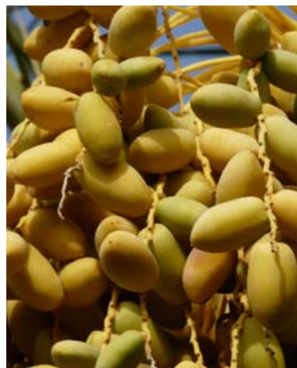
SÜSS. Datteln, die von den Kindern per Steinwurf von den Bäumen geholt werden.

tel an Viertel, viele jüdische Künstler – vor allem Schlagersänger und -sängerinnen – werden von der muslimischen Bevölkerung sogar geradezu vergöttert.