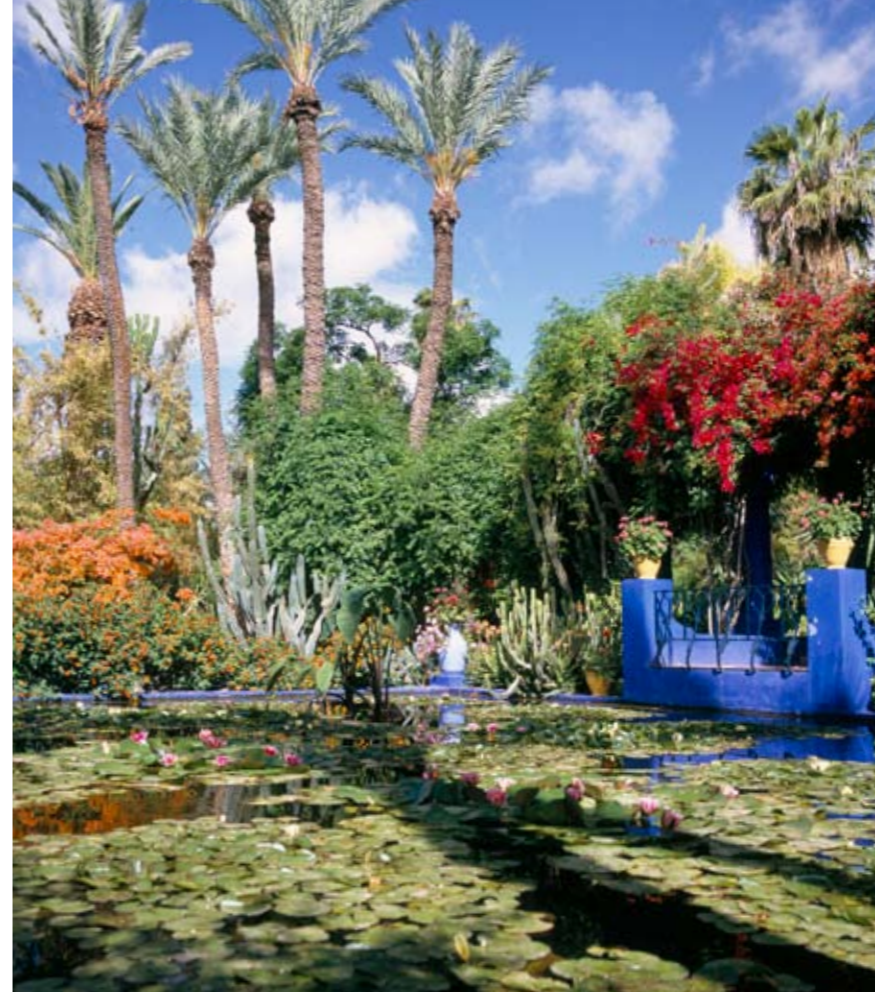
KUNSTVOLL. Der botanische Garten „Jardin Majorelle“, benannt nach dem Maler Jacques Majorelle (1883–1962), wurde von Yves Saint-Laurent zu neuer Blüte gebracht.

Die Rolle der Herzdame wird von Travestiten gespielt, deren Attraktivität und Anmut sich durchaus mit der märchenhaften Schönheit von Sheherazade messen könnte.