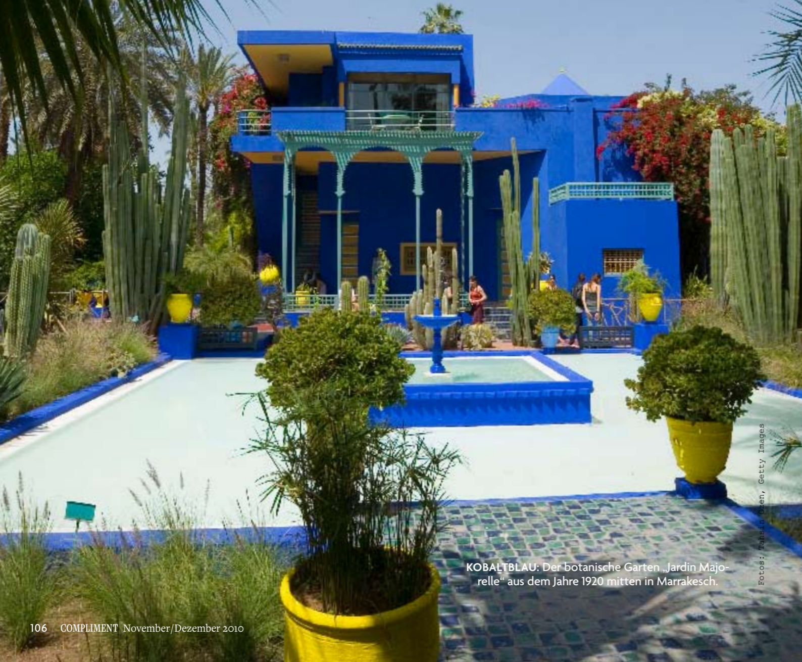
KOBALTBLAU: Der botanische Garten „Jardin Majorelle“ aus dem Jahre 1920 mitten in Marrakesch.