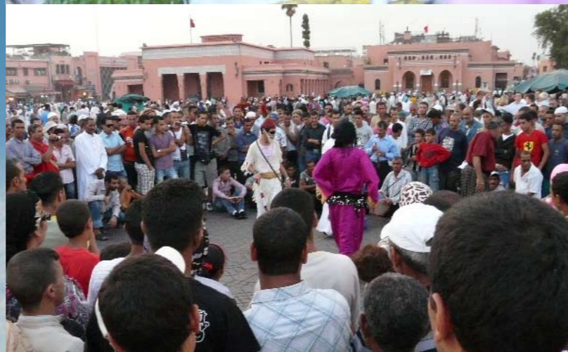
SEHENSWERT. Die Koutoubia-Moschee aus dem Jahre 1162, der große Bazar mit exotischen Früchten und orientalischen Gewürzen und ganz besonders die Gaukler, Fakire, Schlangenbeschwörer und mehr am Djemaa el Fna – dem Platz der Geköpften.

zeigt sich aber nach außen hin genauso schlicht und verschlossen wie die Riads (Stadtvillen) in der Medina. Ihre volle Pracht entfalten diese Häuser traditionsgemäß nach innen. Alles öffnet sich auf den von Säulen getragenen Vierkanthof, der sich wiederum dem Himmel öffnet. So kann es durchaus vorkommen, dass man z.B. von einem Teppichhändler durch eine schmale Tür in den kleinen Laden gebeten wird und sich dann plötzlich in einem Stadtpalais mit prächtigen Sälen und kostbaren Wandteppichen wiederfindet.