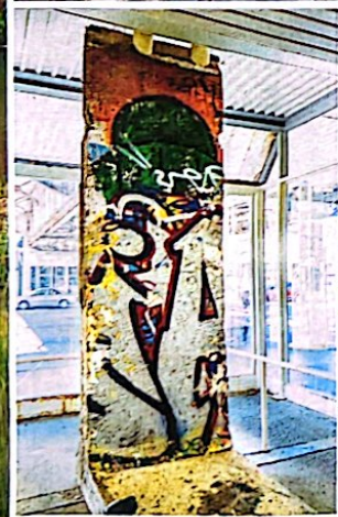
Ein Stück Berliner Mauer in Chicago: Das gespendete Segment stammte aus dem vierten Bauabschnitt, der Grenzmauer 75