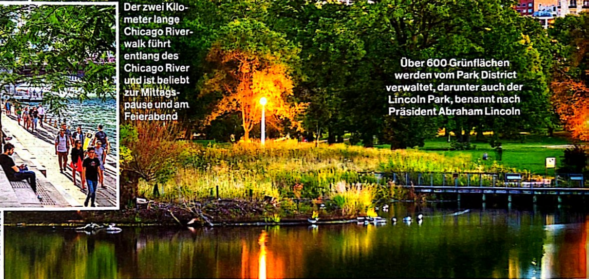
Über 600 Grünflächen werden vom Park District verwaltet, darunter auch der Lincoln Park, benannt nach Präsident Abraham Lincoln

E in wenig vergessen wirkt das Fragment der Berliner Mauer, das einst am Potsdamer Platz stand und seit 2008 in einer wenig frequentierten Ecke der Bahnstation „Western“ in Chicago zu finden ist. Passenderweise befindet sich das „Berlin Wall Monument“ im Viertel „Lincoln Square“, das 1840 von deutschen Einwanderern gegründet wurde. Hier gibt es heute noch Restaurants und Kneipen