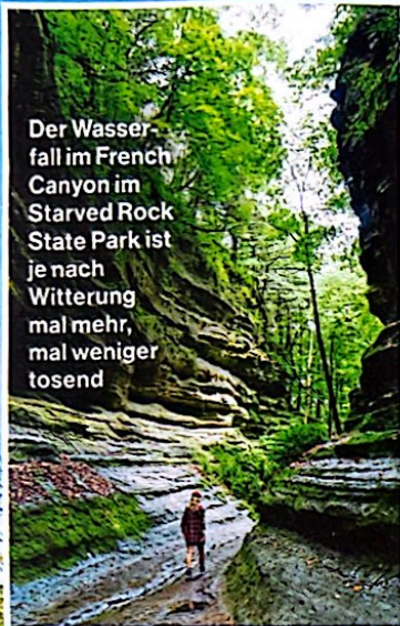
Der Wasserfall im French Canyon im Starved Rock State Park ist je nach Witterung mal mehr, mal weniger tosend

Die drittgrößte Stadt der USA lockt nicht nur mit Architektur, Kunst und ganz viel Grün zwischen modernen Wolkenkratzern , sondern auch mit einer reizvollen und erlebnisreichen Umgebung