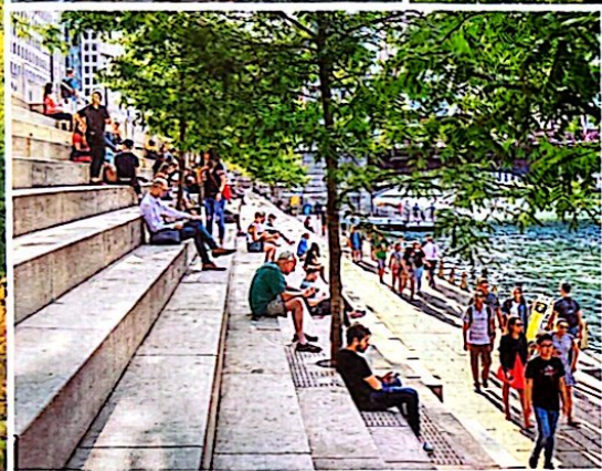
Der zwei Kilometer lange Chicago Riverwalk führt entlang des Chicago River und ist beliebt zur Mittagspause und am Feierabend