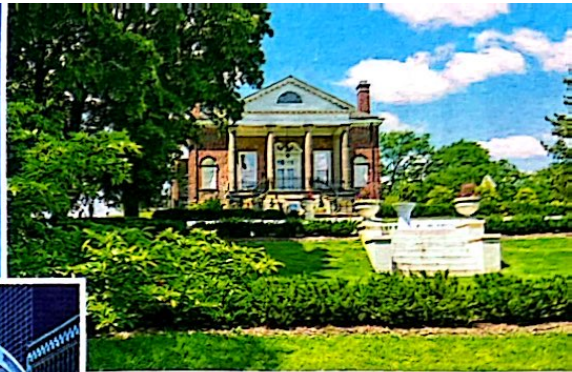
Das ehemalige Wohnhaus Robert R. McCormicks im Cantigny Park, das jährlich über 300 000 Besucher anzieht