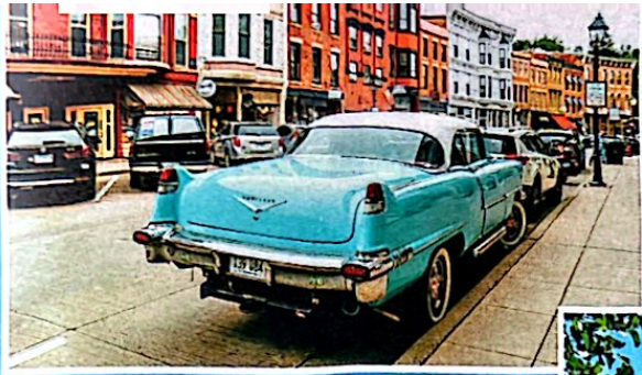
Auf der Hauptstraße von Galena, findet man Galerien, Spezialitäten-geschäfte und Restaurants – und so manchen Oldtimer