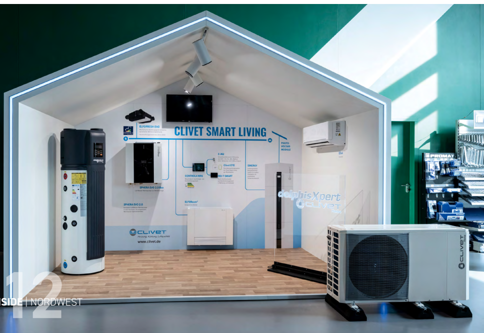
Das begehbare Clivet-Haus, bestückt mit delphisXpert-Produkten