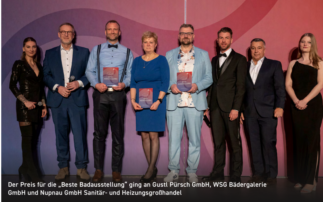
Der Preis für die „Beste Badausstellung“ ging an Gustl Pürsch GmbH, WSG Bädergalerie GmbH und Nupnau GmbH Sanitär- und Heizungs Großhandel