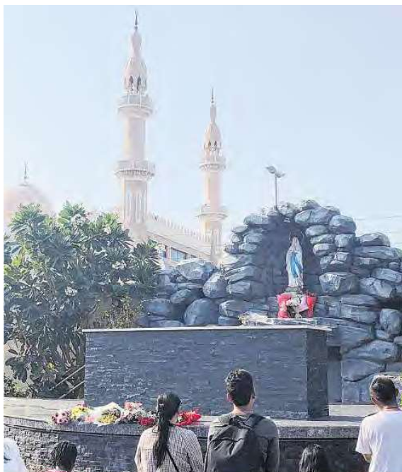
Lourdesgrotte vor Moscheehintergrund: St. Mary's Church.

Die St. Mary's Catholic Church ist von hier oben nicht auszumachen. Doch auch wenn die schlichte Kirche winzig ist im Vergleich zu den Prunkbauten der Stadt: Für die hier lebenden Christen aus aller Welt ist sie erste Anlaufstelle, religiöses Zentrum – und damit wahrscheinlich das wichtigste Gebäude der Stadt.