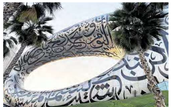
Moderne Baukunst: Das Zukunftsmuseum.