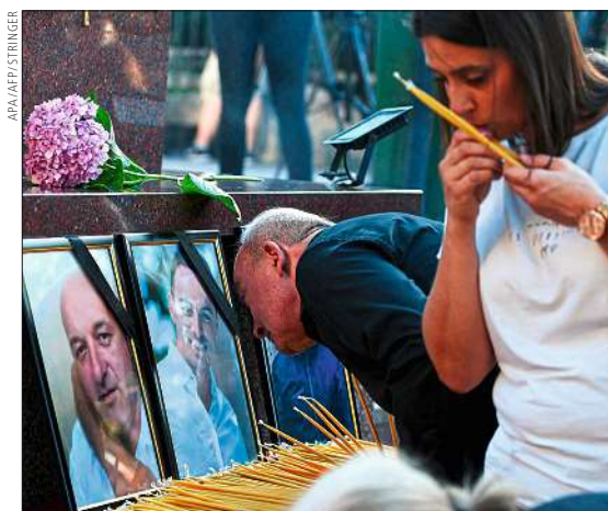
IM SERBISCH DOMINIERTEN NORDEN Die Kosovo-Serben glorifizieren die getöteten Angreifer.

Die beiden sind 27 und 33 Jahre alt und leben im Nordkosovo. Sie heißen eigentlich anders und wollen anonym bleiben. Das Treffen findet in einer Bar im Norden der Stadt Mitrovica statt. Hier kann man, anders als im ethnisch-albanischen Süden, mit serbischen Dinar bezahlen. Auf der Straße flattern serbische Fahnen, und die Autofahrer weigern sich seit über einem Jahr, Kfz-Kennzeichen mit dem Wap-