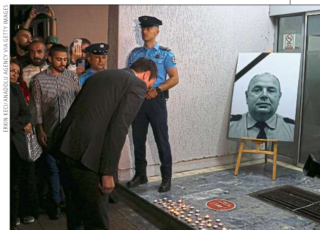
SÜDLICH VON MITROVICA Ministerpräsident Kurti nennt die Angreifer Terroristen.