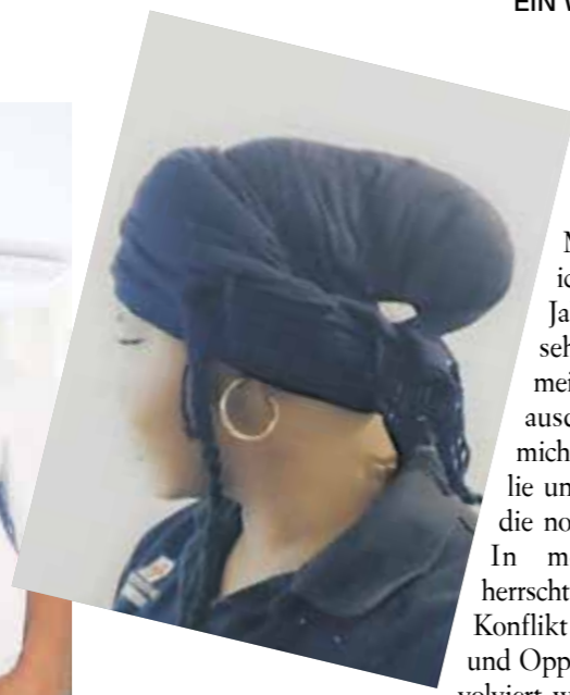
Ihr Kopftuch erinnert sie an ihre vier Kin- der, die sie seit sieben Jahren vermisst. © Rabiatu Yusufu