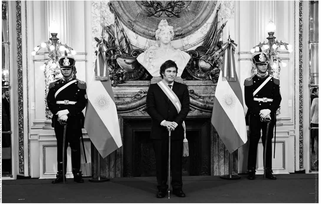
Javier Milei, der neue Präsident Argentiniens: Richtig rund lief seine Amtszeit bisher nicht.

In der Bevölkerung ist die Unterstützung für Milei mit knapp 50 Prozent zwar weiterhin stabil, aber die Zustimmung für seinen radikalen Staatsumbau ist brüchig. Nach einer Erhebung des Umfrageinstituts Zubán Córdoba waren Ende Januar nur 34 Prozent der Menschen ohne Einschränkungen für das Omnibus-Gesetz, 17 Prozent forderten Änderungen, knapp die Hälfte ist komplett dagegen. Die argentinische Gesellschaft ist in ihrer Mehrheit, anders als der selbsterklärte Anarchokapitalist Milei, nicht per se gegen den Staat und seine Institutionen