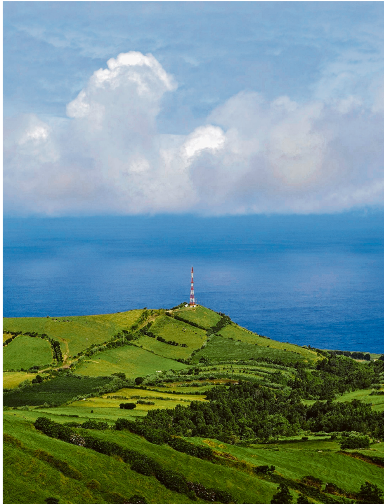
2001 geriet ein Drogenboot vor São Miguel in Seenot. Die Folgen für die Bewohner der Azoreninsel waren verheerend.

2001 brachte das Kokain das Fischerdorf in die lokalen Schlagzeilen. Im Frühling 2023 wurde Rabo de Peixe weit über die Azoren hinaus berühmt. Zu verdanken hat dies der Ort einer gleichnamigen Netflix-Produktion. Die sieben-teilige Serie basiert auf den Geschehnissen von damals. Sie nimmt sich aber