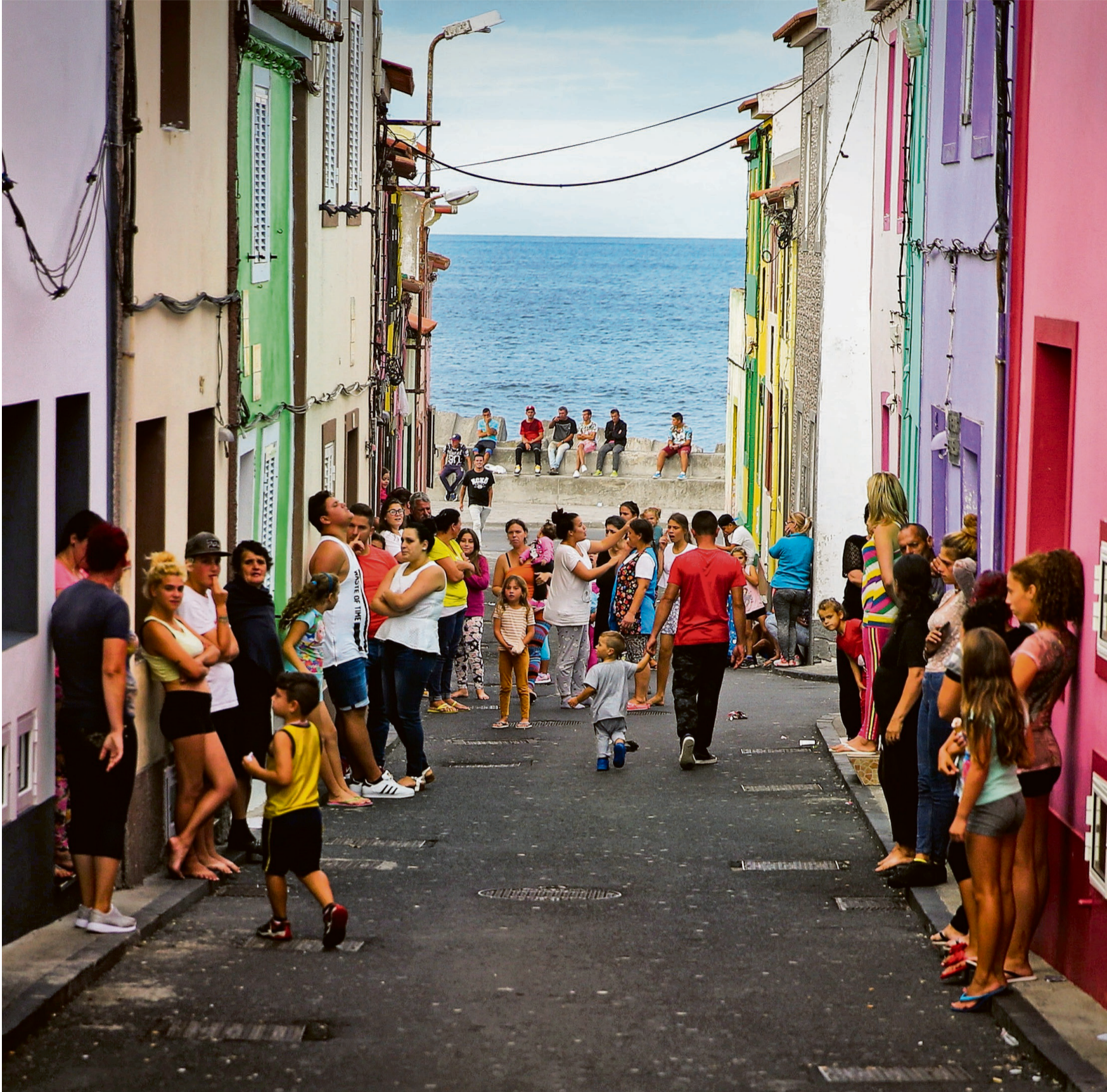
Die bunten Fassaden von Rabo de Peixe täuschen: Viele Menschen in dem Fischerdorf sind arm und ohne Perspektive.