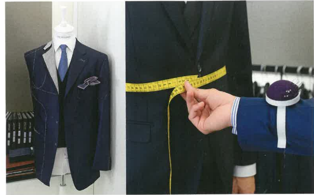
Schnittmenge: Im „Maßhemd“ wird naturgemäß auf das perfekte Maß wert gelegt