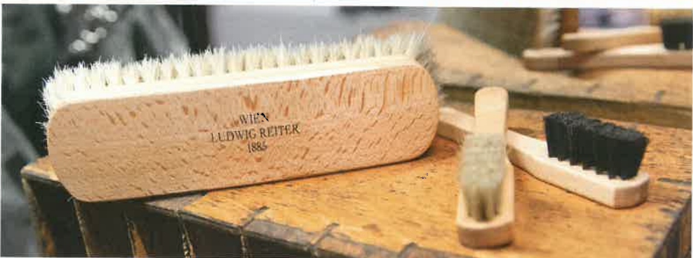
Saubere Angelegenheit: Zum angemessenen Schuh gehört ein ordentliches Pflegewerkzeug

Ständern mit Maschen und Stecktüchern. Der Laden ist bunt, sein Inhaber dogmatisch. Kein Frack oder Smoking? „Das wird dann halt kein Ball, eher eine Abendveranstaltung“, sagt er.