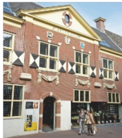
> Das Vermeer Centrum in Delft zeigt alle Gemälde als hochwertige Kopien in Originalgröße

Das erklärt die gleißenden Lichtpunkte, die seine Werke geradezu magisch strahlen lassen. Auch das findet sich nur bei ihm und bei der Camera obscura, denn die lässt stark beleuchtete Dinge im Licht zerfließen. Beim Milchmädchen überträgt Vermeer diesen Effekt auf Brot, bei der Ansicht von Delft (um 1660/61) auf Dächer, Gemäuer und die Schiffe im Hafen. Das großformatige Panoramabild ist seine einzige Stadtvedute. Doch während andere Maler auch mal schummeln und zur Identifizierung von Stadt oder Landschaft charakteristische Bauwerke zusammenrücken, bleibt bei Vermeer im Grunde alles an der rich-