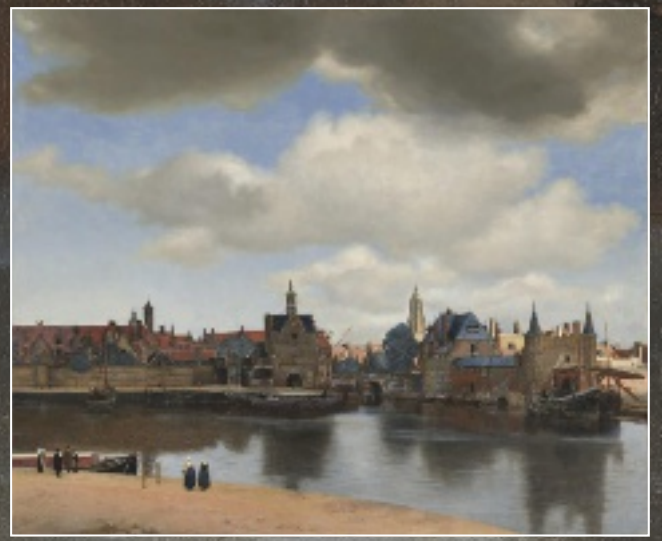
ANSICHT VON DELFT, UM 1660/61, 97 X 116 CM

> Nirgendwo in seiner Geburtsstadt Delft ist die Existenz des Malers wirklich greifbar