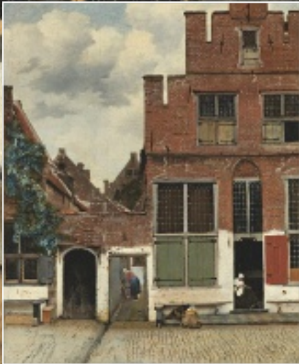
< Ursprünglich befand sich die Frau im Eingang (zu sehen im Bild links) neben der Frau im Durchgang STRASSE IN DELFT, UM 1658, 54 X 44 CM