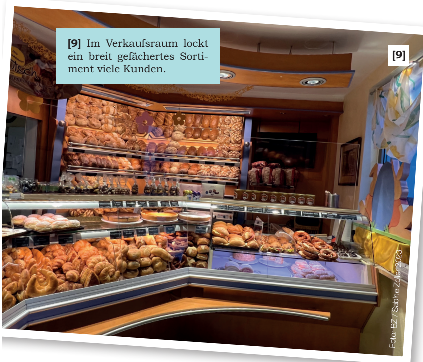
[9] Im Verkaufsraum lockt ein breit gefächertes Sortiment viele Kunden.