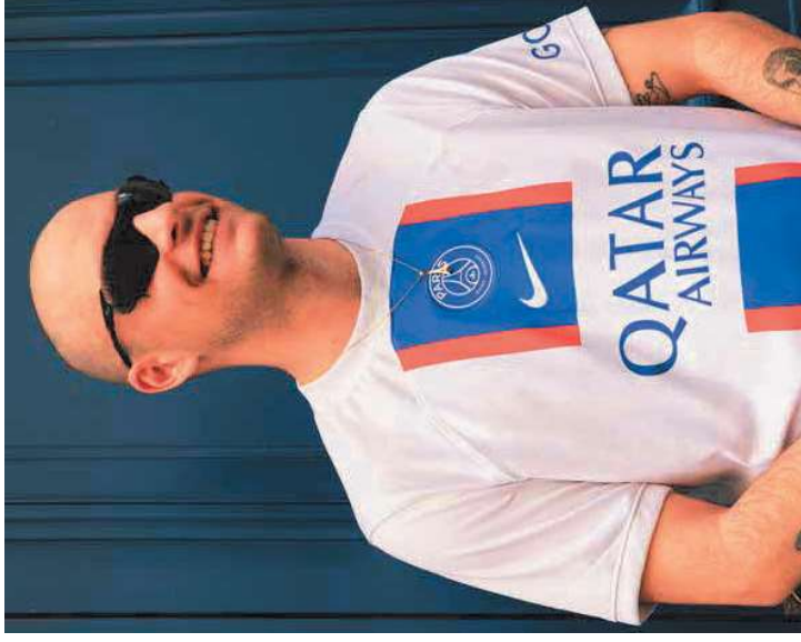
Maillot third 22/23, PSG