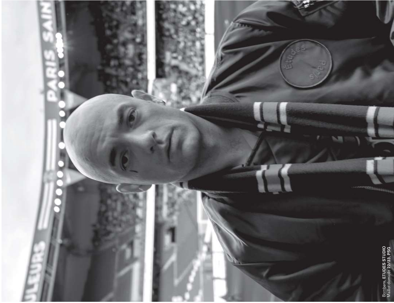
Bombers, ETUDES STUDIO Maillot domicile 22/23, PSG