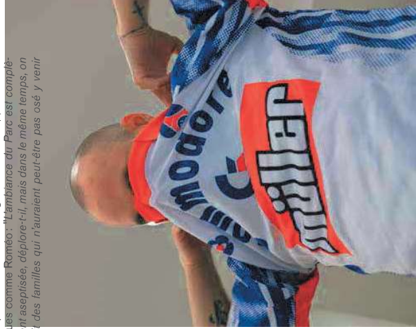
Maillot Heritage 92/93, PSG