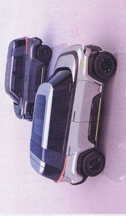
DIE SUMME IHRER (RECYCLING)TEILE

So könnten die Kreislaufautos einmal aussehen: Ein Kleinbus für Pendler, ein Kleinwagen für raumbewusste Verkehrsteilnehmende